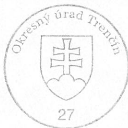
Ing. Oľga Michalcová vedúca odboru

Osvedčenie o živnostenskom oprávnení vydané na základe § 66b ods. 1 v spojení s § 66b ods. 2 písm. a) podľa § 47 ods. 1 v spojení s § 47 ods. 4 a § 10 ods. 4 v súlade s § 10 ods. 5 zákona č. 455/1991 Zb. o živnostenskom podnikaní (živnostenský zákon) v znení neskorších predpisov.