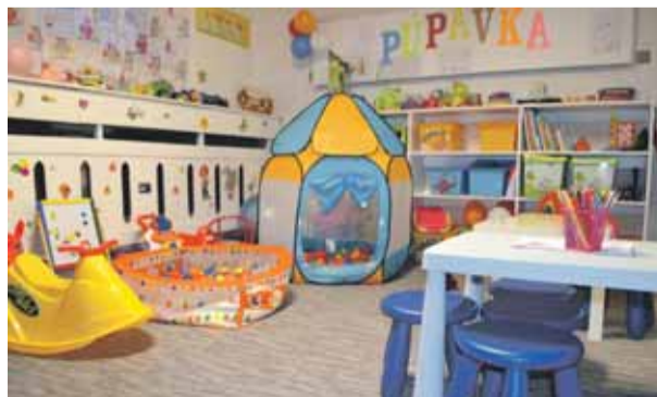
Otvorenie materského centra Púpvka strana č. 5