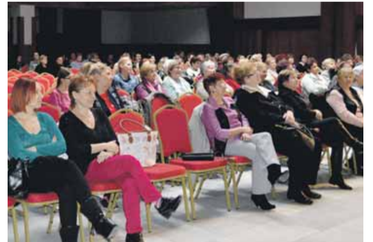
Patrí Vám vďaka