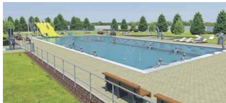
Kúpalisko Nemšová po rekonštrukcii