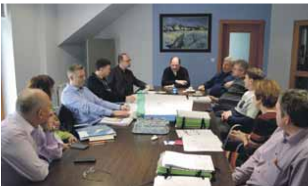
Pracovné stretnutie k príprave kúpaliska strana č. 3