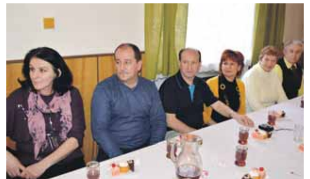
Výročná členská schôdza MS SČK Luborča strana č. 3