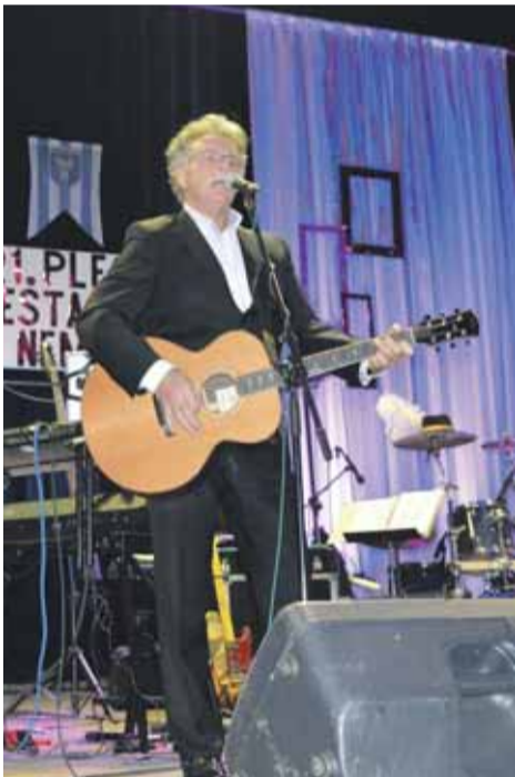
Host Pavol Hammel