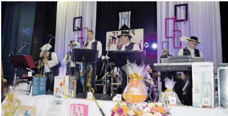
Borovienka opäť na plese v Nemšovej