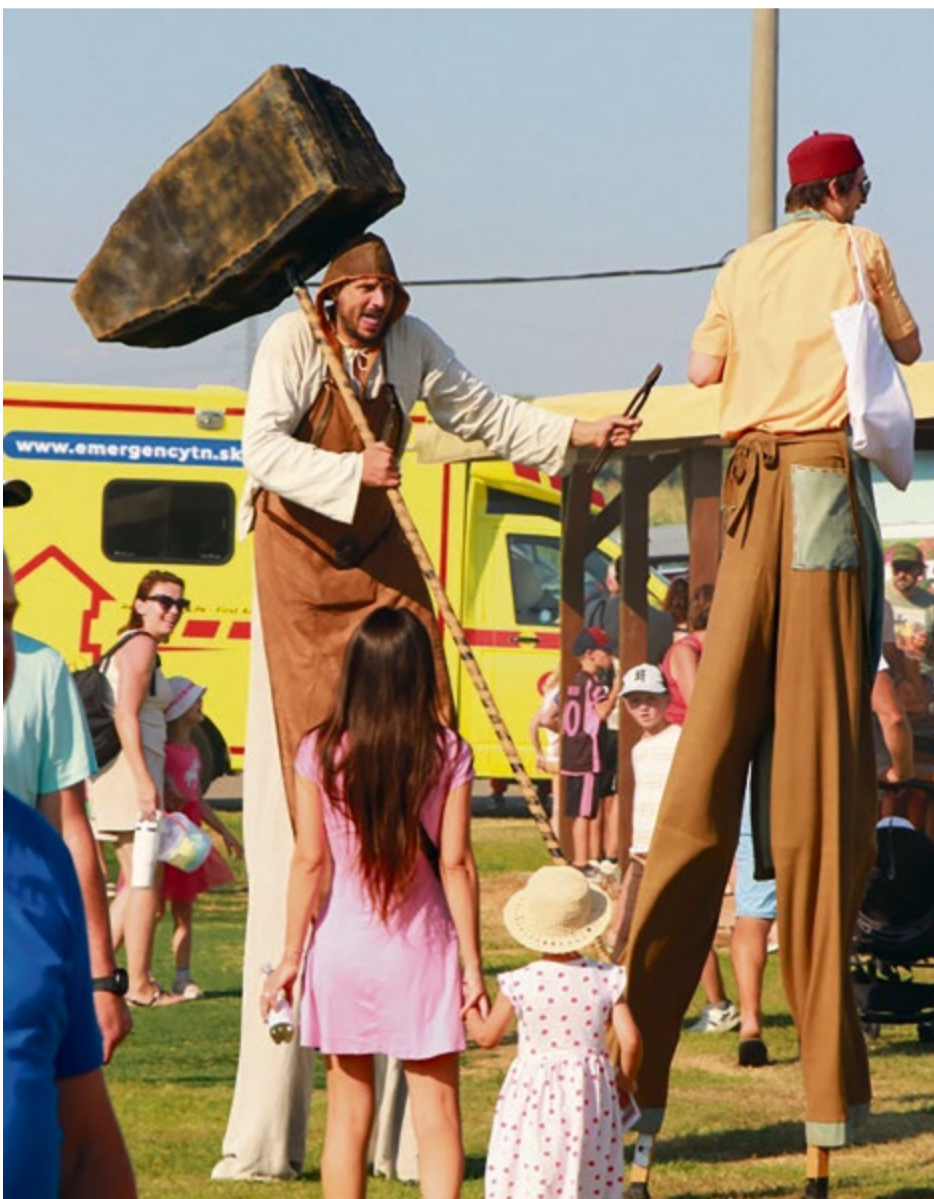
Posledný ročník spestrili aj chodúliari

„Už po štrnástykrát sa v rámci klúčovských hodov uskutočnilo aj milé sobotné rodinné hodové popoludnie. Niekoľko rodín a mladých nadšencov miestnej komunity na spoločných stretnutiach však plánujú de facto už rok dopredu, aby v posledných dňoch a týždňoch dolaďovali detaily blížiacej sa akcie. Pritom každý podľa svojich schopností a možností dotvára spoločný projekt.“ Slovmi manželov Vojtovcov začíname rozprávanie o myšlienke detského hodovania pod názvom Klúčikovo.