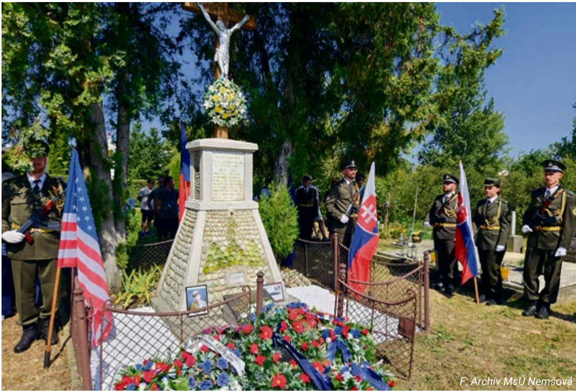
F. Archív MsÚ Nemšová