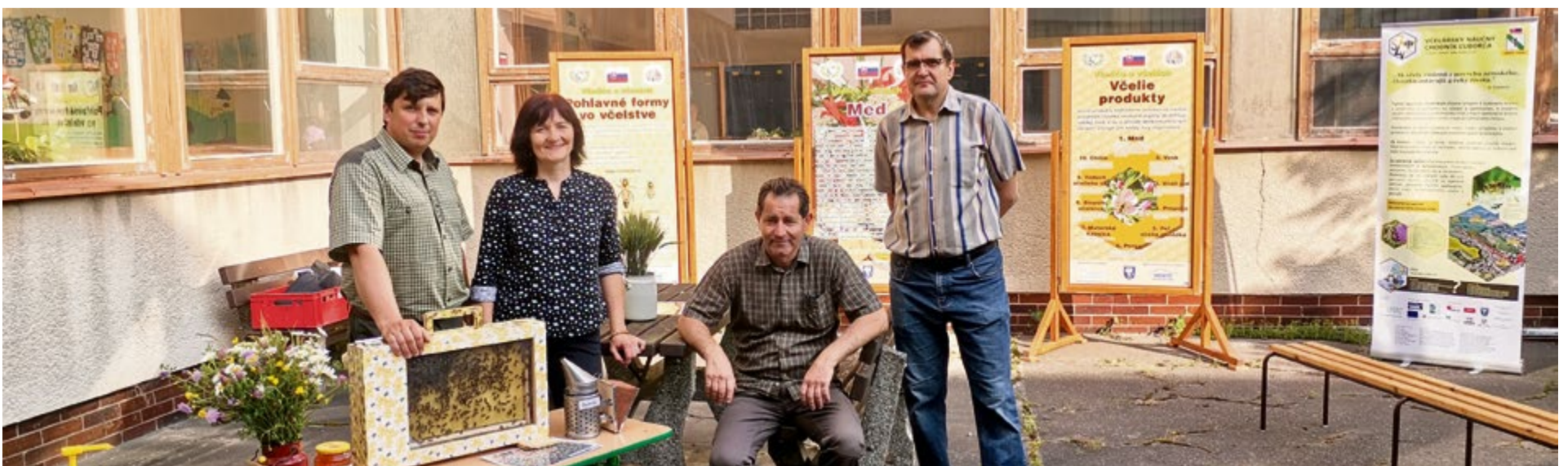
Medové raňajky na základnej škole sv. Michala