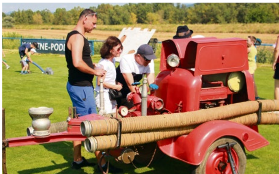
Svoje si tu odmakajú aj dobrovoľní hasiči

Detské hodovanie Klúčikovo organizuje od začiatku občianske združenie, ktoré nesie rovnaký názov ako jeho najväčšia akcia, teda OZ Klúčikovo. Tím, ktorý sa formoval a menil dlhé roky, tvoria učители, muzikanti, manažéri, zdravotníci, ale i stolári. Ako dodáva pán Vavrúš, o 11-členný tím v rámci združenia sa môže kedykoľvek oprieť. Na samotných prípravách sa však v Klúčovom podieľa podstatne viac ľudí, keďže