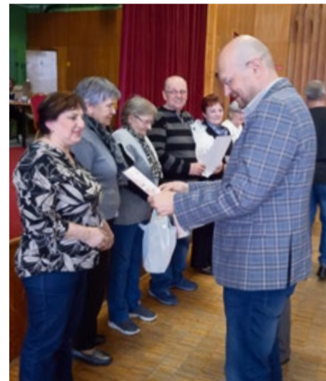
Výročná členská schôdza