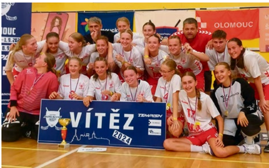
Tempish Moravian Cup