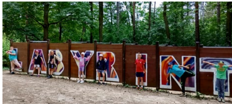
Momenty z letného tábora ZŠ