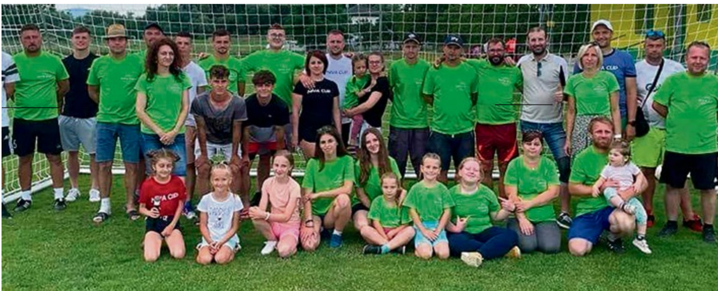
Organizačný tím Niva Cupu tvoria okrem aktívnych či bývalých futbalistov aj ich rodiny

Prejdime ku kovidovému obdobiu. Dokázali ste turnaj usporiadať aj