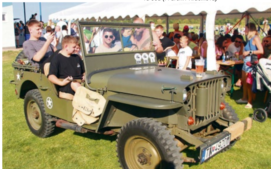
K sprievodným atrakciám patrila aj jazda na džipe