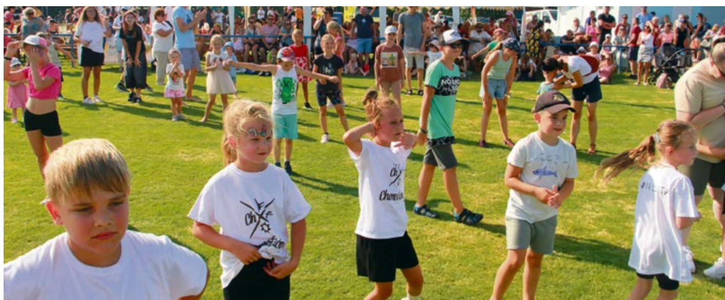
Z vystúpenia tanečnej školy Choreofactory