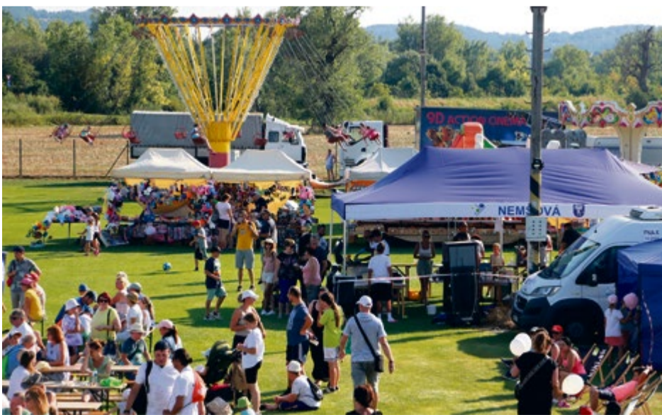
Podobne ako minulý rok, na vedľajšom ihrisku nechýbali ani kolotoče