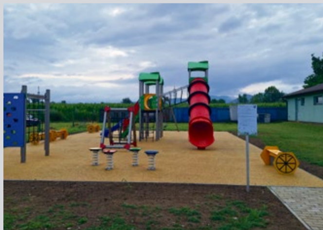
Nové detské ihrisko po prevzatí od zhotoviteľa