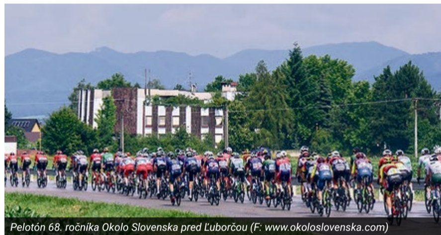
Pelotón 68. ročníka Okolo Slovenska pred Ľuborčou