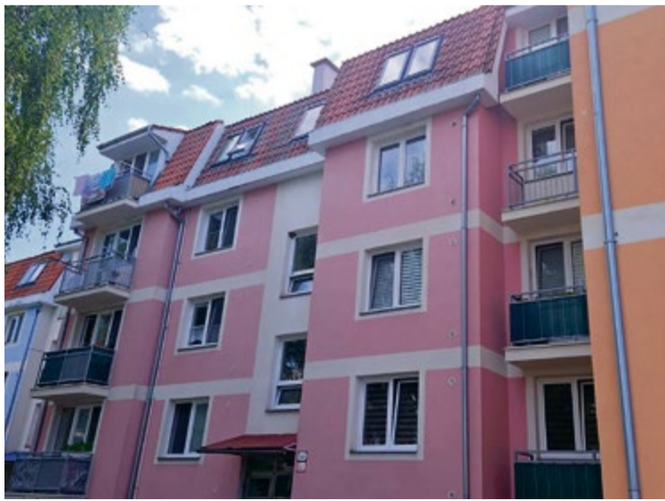
Výmena strešných okien na mestských bytoch

Ešte na konci roku 2023 sa do „dôchodku“ porúčal aj