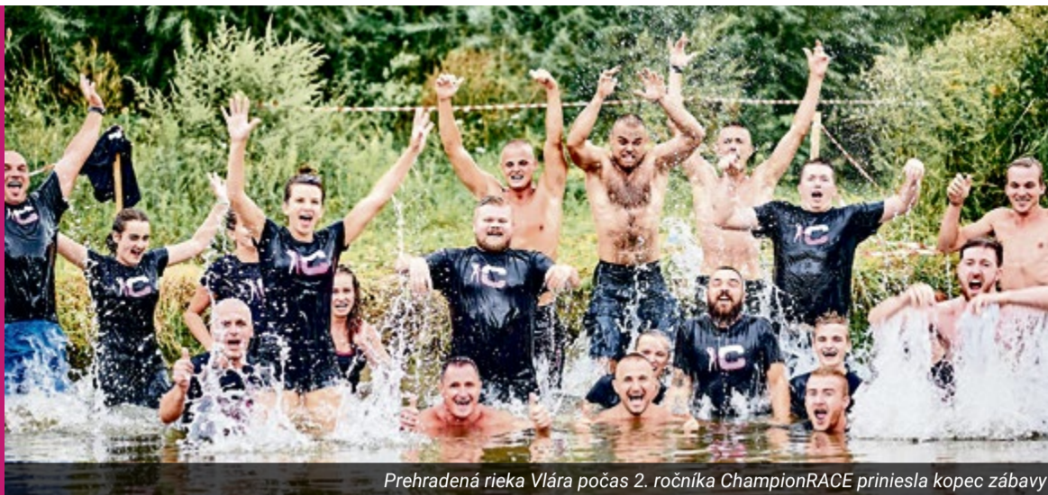
Prehradená rieka Vlára počas 2. ročníka ChampionRACE priniesla kopec zábavy