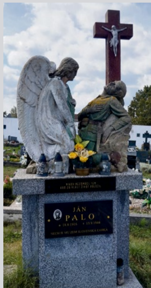
Hrob Janka Palu na starom cintoríne v Nemšovej