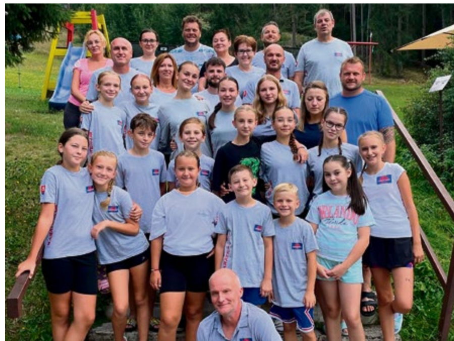
KK Mugen s rodičmi na letnom sústredení v Závažnej Porube