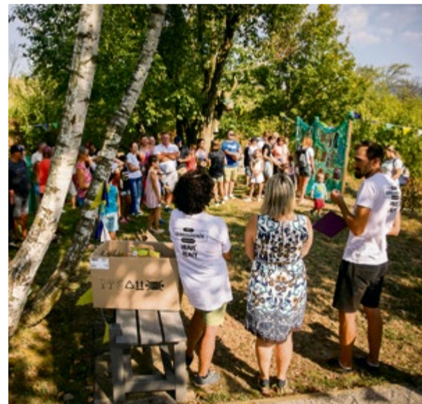
Oceňovanie víťazných prác 4. ročníka súťaže Lacove chrobáky