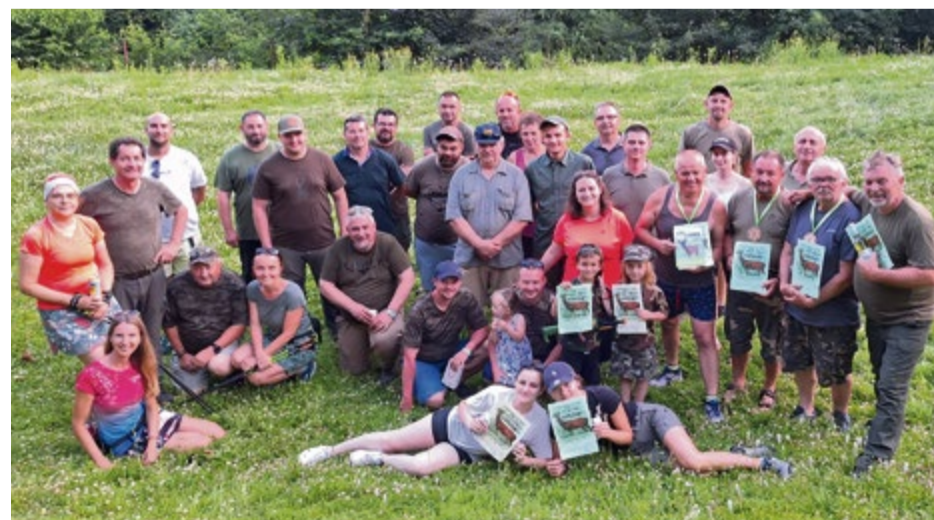
PZ Háj Klúčové - stretnutie na poľovníckej chate v Klúčovskej doline - jún, mesiac poľovníctva