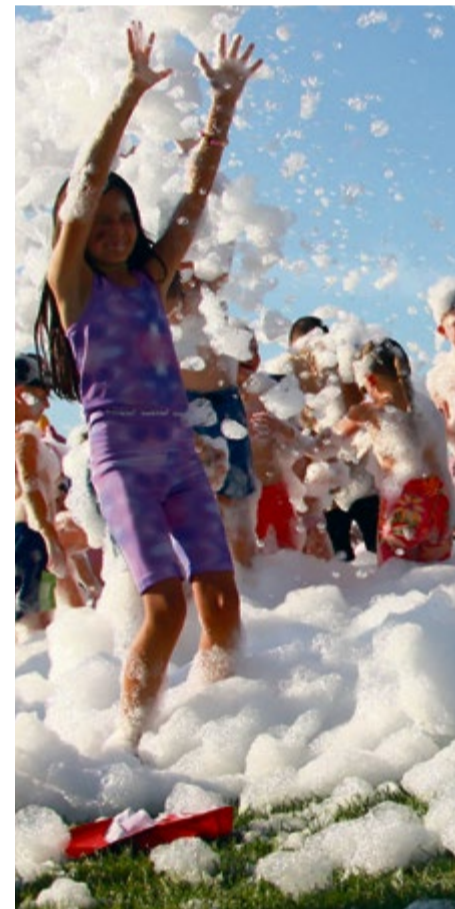
Jedným z vrcholov programu pre deti bola penová šou