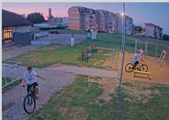
Poškodzovanie detského ihriska