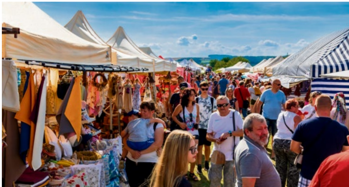
Návštevníci po otvorení jarmoku