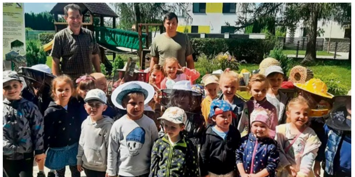
Prednáška v Materskej škole sv. Gabriela