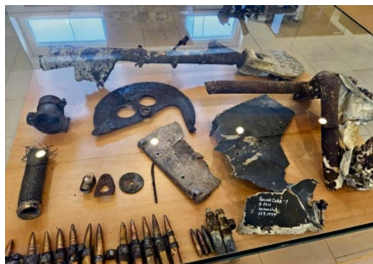
Rozšírená časť expozície v mestskom múzeu v Nemšovej

— Spomienkové akcie pokračovali dňa 30. 8. v Liptále a Kašave, v sobotu 31. 8. v Slavičine, Krhové, Přečkovicích, Rudicích, a 1. 9. boli ukončené v Šanove a Vyškovci. Dňa 31. 8. 2024 sa o 10:00 konal pietny akt na cintoríne