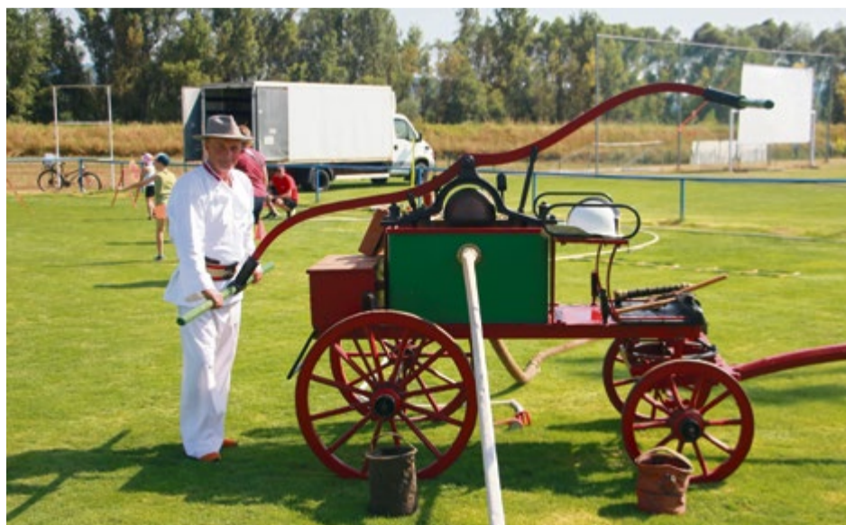
Deti mohli obdivovať aj historickú hasičskú techniku