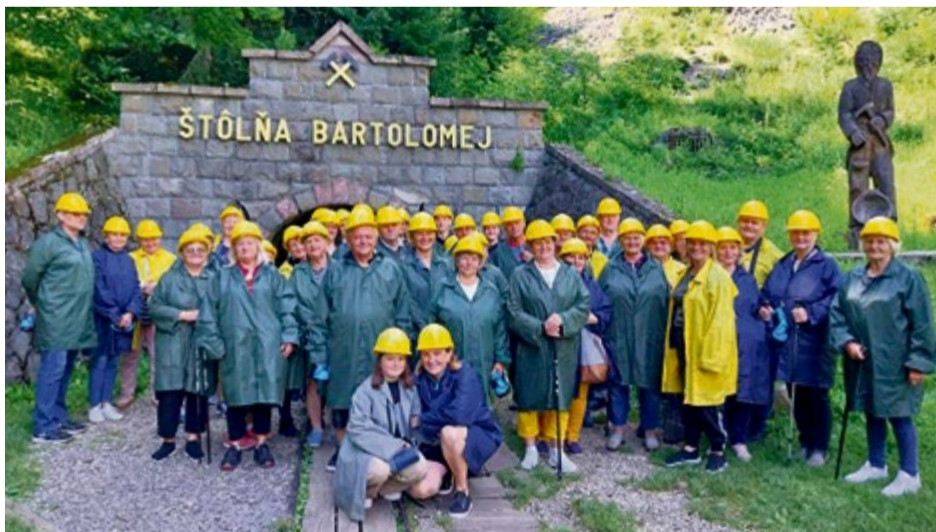
Návšteva Banskej Štiavnice