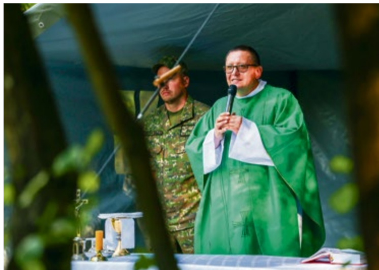
Polná omša v Antonstálskej doline