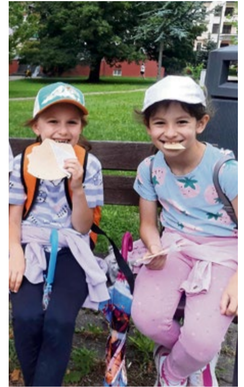
Letný tábor - sladké spomienky