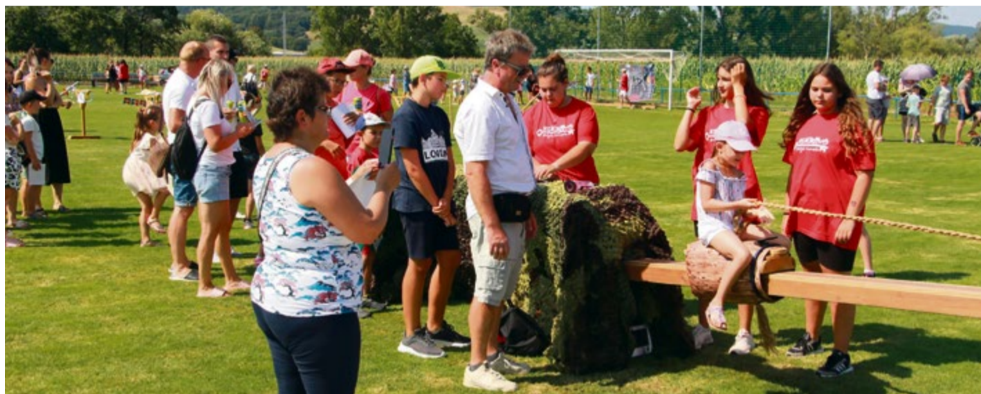
Deti na jednom zo stanovišť zachraňovali princeznú