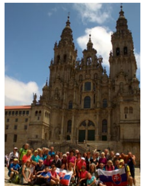
Účastníci zájazdu pred chrámom sv. Jakuba

Počas celej cesty zbiera pútnik pečiatky do tzv. Credencialu, pasu pútnika. Ak prejde pútnik aspoň 100 km a za deň získa dve pečiatky, na konci cesty získa certifikát o absolvovaní púte do Compostely. Na konci cesty, v kostole sv. Jakuba sa nachádza socha s relikviami sv. Jakuba. Vraj až vtedy sa končí púť, ak ju objímete ale-