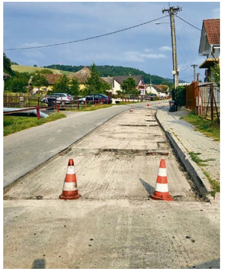
Reklamácia prác na Ulici Závadská

Na BRO došlo v poslednom období k rozsiahlym opravám technického vybavenia. Ako prvá bola nutná generálka stroja „Samuraj“, stroja, ktorý drví, seká, mieša hmotu pre kompost. Tento stroj si ničíme všetci, a to vtedy, keď sme roztržití a podarí sa nám do našich hnedých nádob zamiešať veci, ktoré do bioodpadu nepatria (kamene, železný šrot a pod.). Keďže legislatíva pri spracovaní bioodpadu, a to najmä kuchynského odpadu, je neúprosná, mesto musí každoročne vynakladať finančné prostriedky na jeho úpravu a spracovanie. Kuchynský odpad sme povinní zbierať a správne zhodnocovať. Kuchynský odpad spracúva špeciálny stroj – fermentor. Neodkážeme vysvetliť podrobne a odborne celý proces, ale povieme len, že kuchynský odpad predtým, ako sa umiestni do kompostu, musí prejsť určitým stupňom zahriatia na