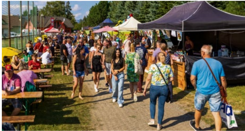
Nemšovský jarmok počas dňa

■ "Keby sme si to mali rozdeliť, tak technické zabezpečenie jarmoku na kultúrnu akciu stojí približne 15 000 a ďalších 20 000 € potrebujeme ešte na zapltenie hudobných skupín. Na jarmoku sa prenájma mnohé a všetko to zdraželo, od prestrešenia, pódia, podlahy, prípojok na elektrinu, toaliet i cez