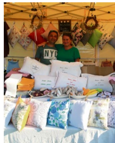
Do koloritu Klúčikova patria aj predajné stánky a dobrá nálada