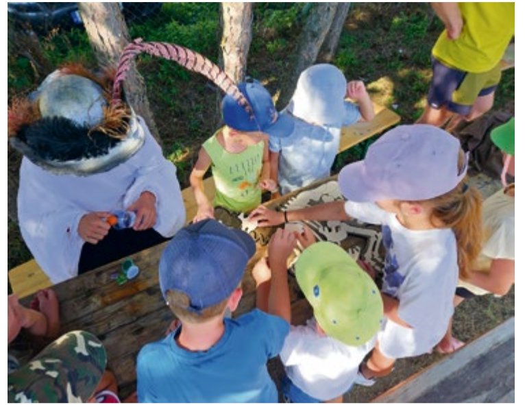
Aktivity na pirátskom dni