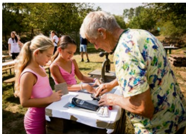
Miestne dievčatá pri tvorbe obrazu z linorytu

Miroslava Bachratá