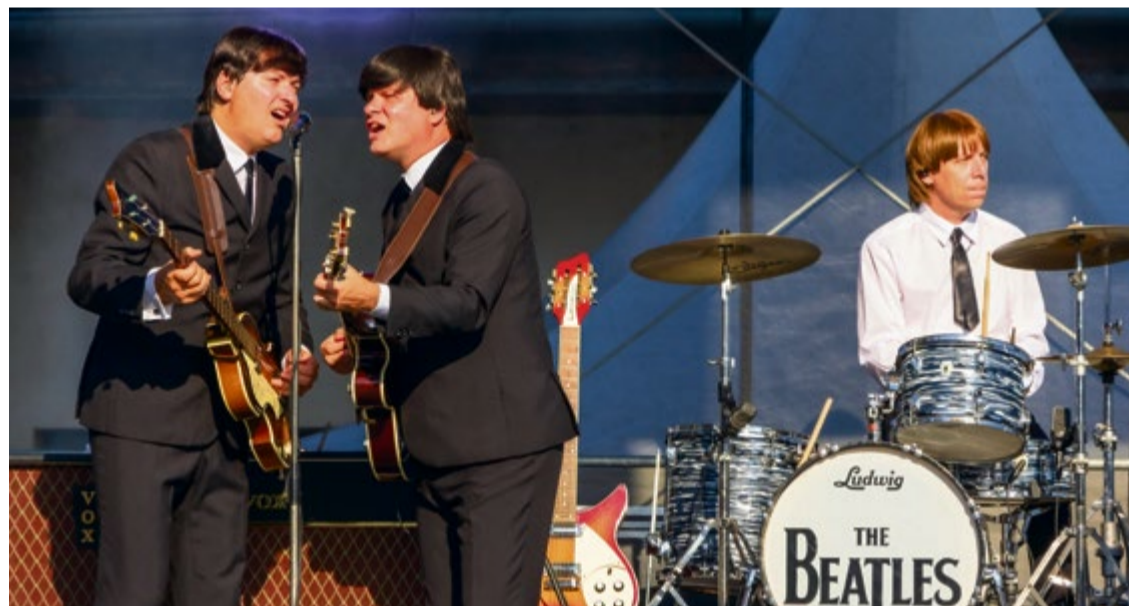
Najväčšie hity od skupiny Beatles v podaní Beatles revival