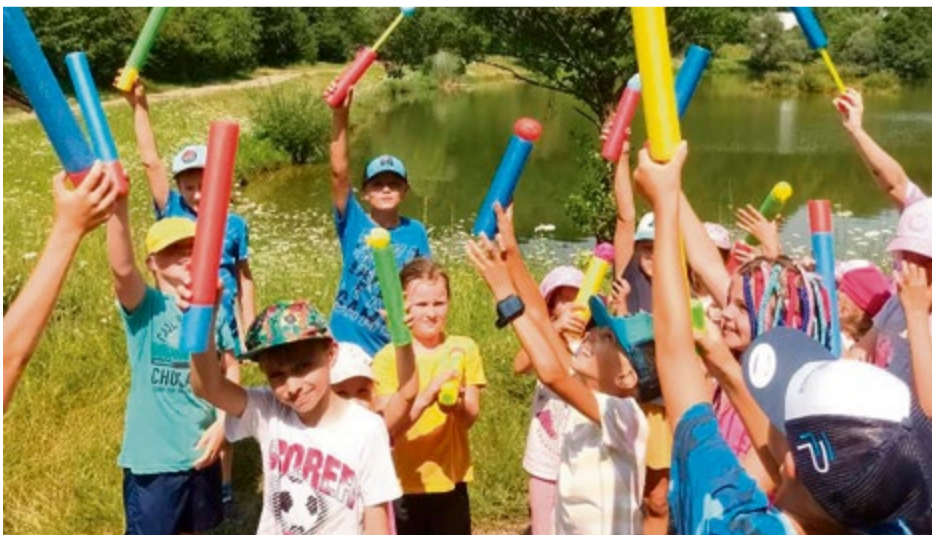
Tábor Športovček - deti hľadali pirátsky poklad a osviežili sa pri rieke Vlára