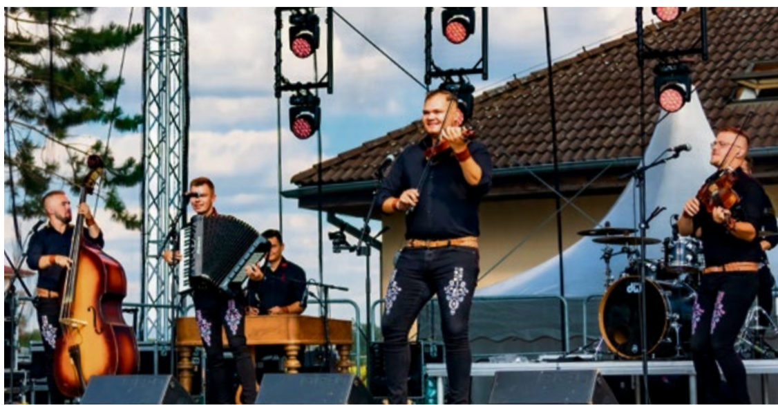
Na začiatku prvého dňa rozospievala dav kapela Basawel