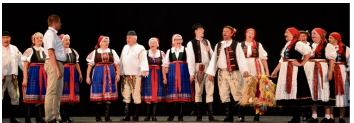
Vystúpenie folklórnej skupiny Liborčan