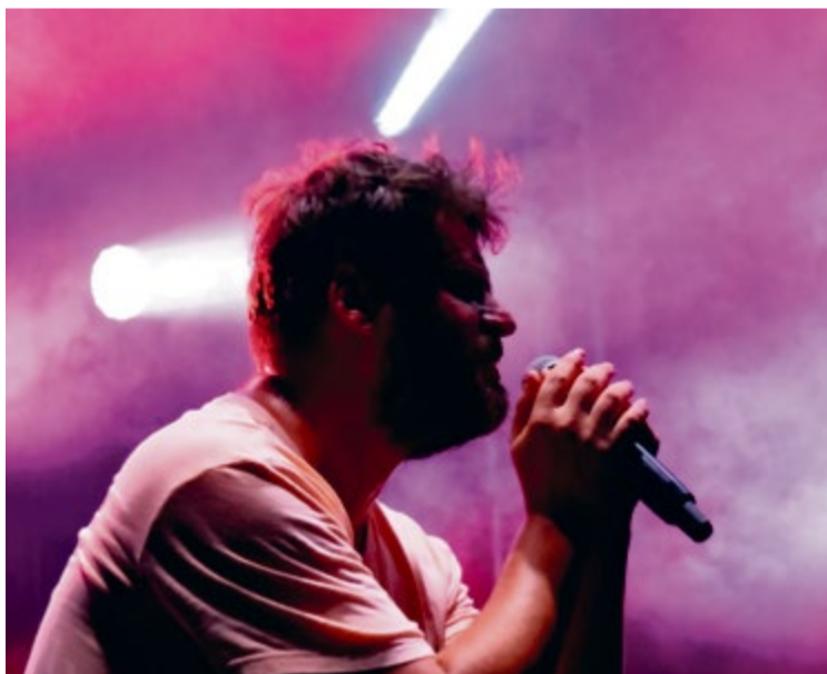
Vystúpenie hudobnej skupiny Mafia Corner

► Na našom tradičnom jarmoku mali návštevníci možnosť zakúpiť výrobky tradičnej ručnej výroby, hračky, oblečenie, cukrovinky, šperky, živé rastliny, či rôzne doplnky do domácnosti. Atmosféru jarmoku násobia kolotoče, nafukovací hrad a rôzne zábavné atrakcie pre deti. Návštevníci sa mohli občerstviť v 30-tich stánkoch, ktoré ponúkali mäsové dobrotky, langoše, zemiakové placky, hranolky, ale aj trdelníky