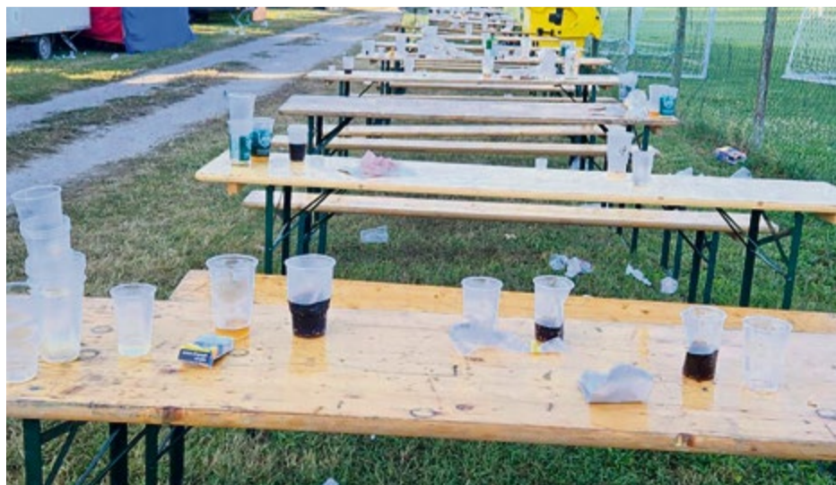
Areál NTS v sobotu ráno po piatkovom jarmočnom dni

■ "Áno, jarmok ostáva v priestoroch NTS a neplánujeme to zmeniť, pretože preniesť jarmok v tých rozmeroch, ako ho máme dnes, niekde do mestských priestorov je nereálne. Kolotoče by sme nemali kde umiestniť, ani kultúrny program by nemal kde byť. Kde umiestnite toľko ľudí ako tu," uviedol zástupca primátora.