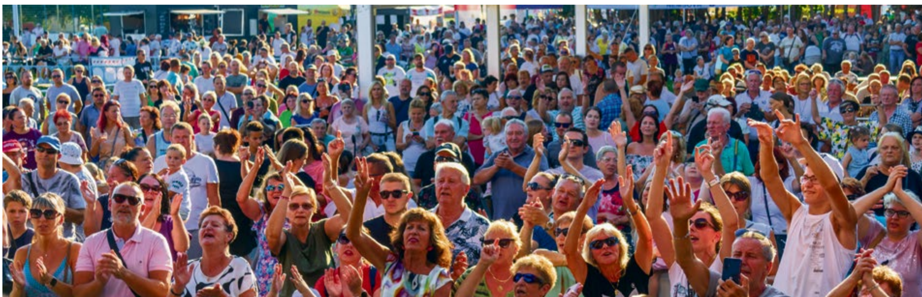
Dav ľudí počas kultúrneho programu