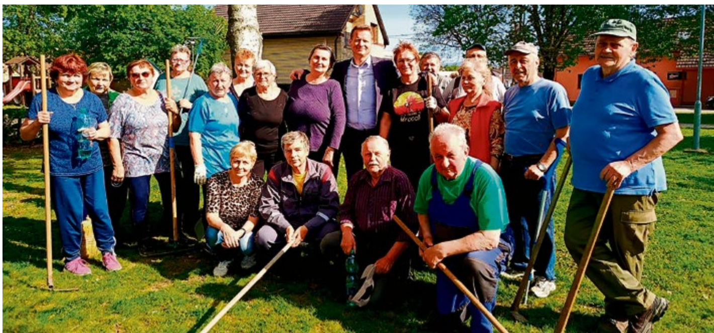
Brigáda členov združenia