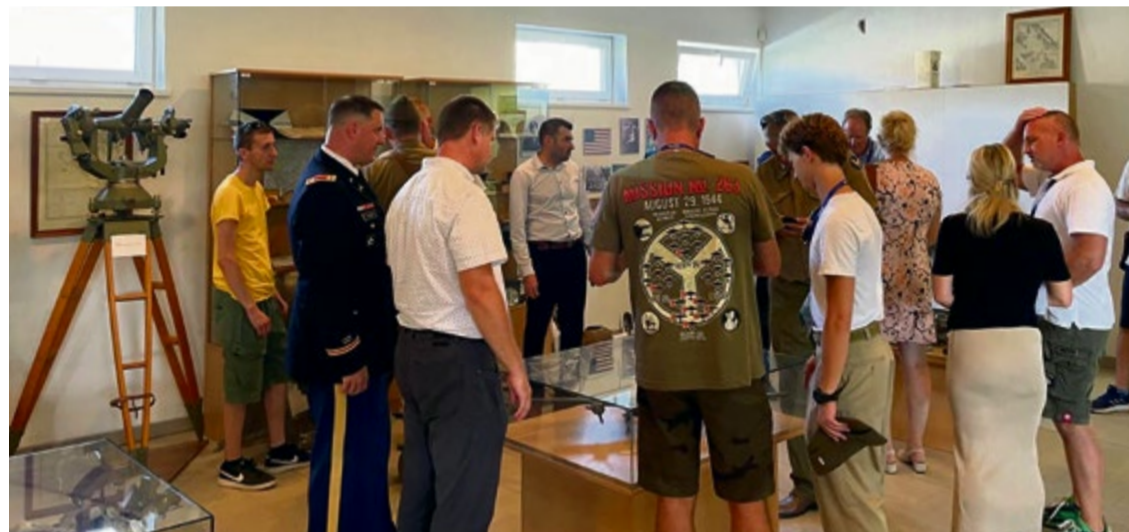
Americká návšteva pri rozšírení expozície havarovaného bombardéru v mestskom múzeu