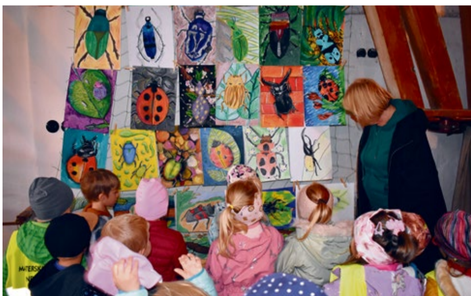
Na výstave Lacových chrobákov