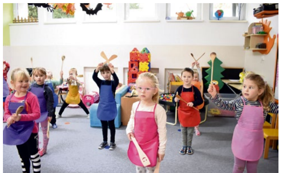
Podme spolu variť - MŠ Odbojárov