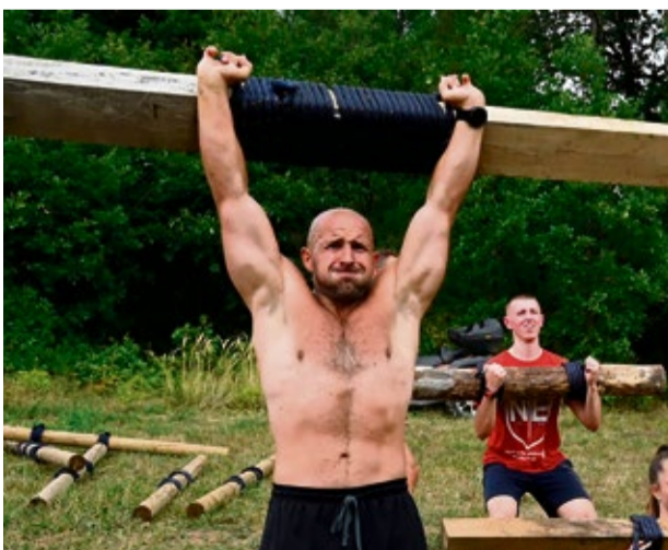
Jednou z najťažších prekážok preteku je absolvovanie 500 m veľmi strmého prevýšenia, kde na vrchole čaká na pretekára 10 čelných drepov s výrazom klady nad hlavu.

■ Berieme so sebou mládež a ľudí, ktorí majú cez prázdniny čas. V Záva-