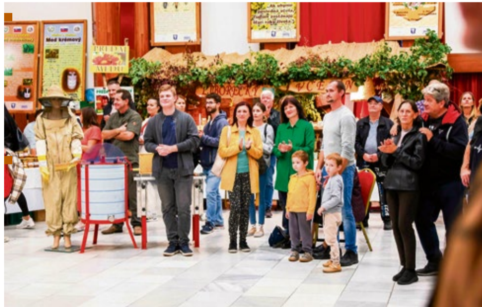
Návštevníci na otvorení výstavy ovocia, zeleniny a kvetov