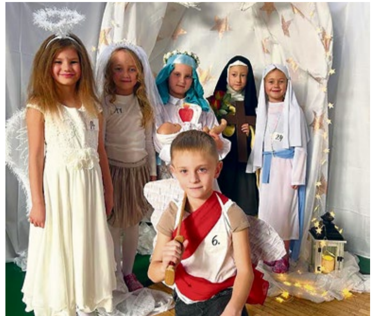
Nebo na zemi