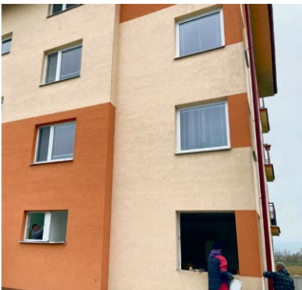
Výmena okien spoločnosťou HELUS, s. r. o.

Mesto Nemšová na základe podpísania zmluvy so Štátnym fondom rozvoja bývania a zmluvy so zhotoviteľom stavby s názvom „Zateplenie bytového domu, Nemšová – 16 BJ“, odovzdala stavenisko spoločnosti HELUS, s. r. o. dňa 5. 11. 2024.