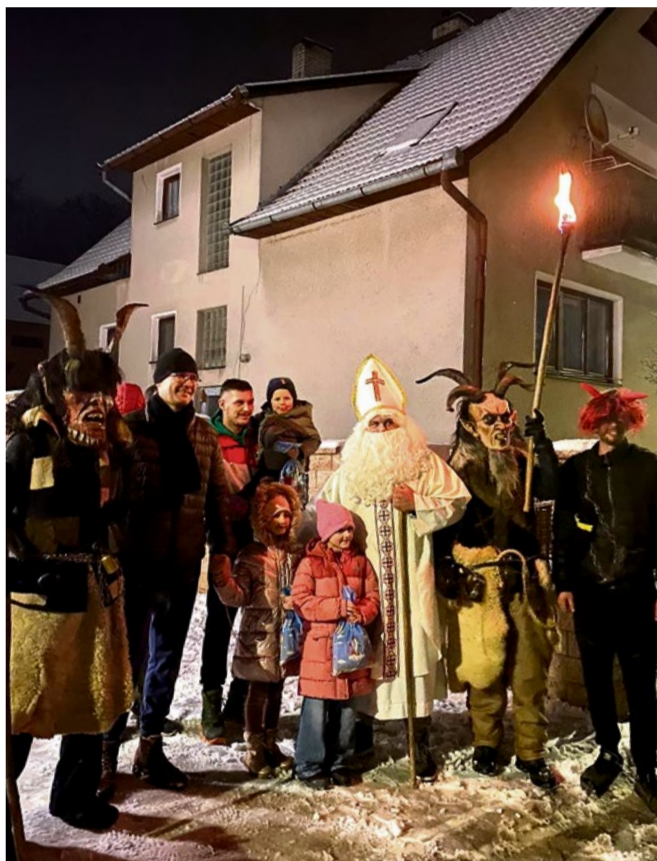
Mikulášsky sprievod v mestskej časti Trenčianska Závada

dopínali aj dve masky čertov, ktoré s horiacimi faklami v ruke pôsobili hrôzostrašne aj pre mnohých dospelých. Plamene a poletujúci sneh umocňovali čarovnú atmosféru celej akcie.