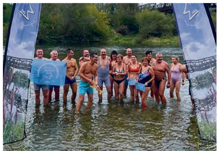
Z otvorenia otužileckej sezóny