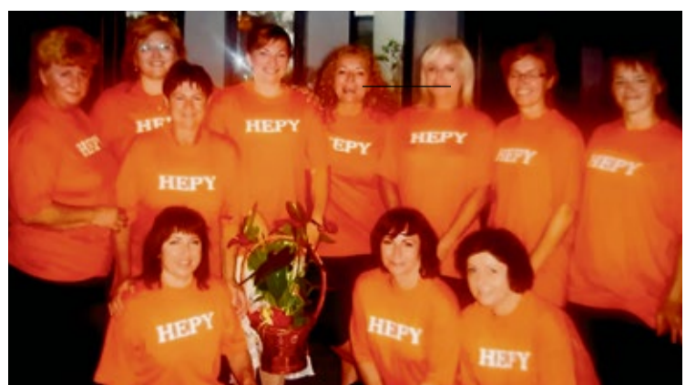
Volejbalová skupina HEPY