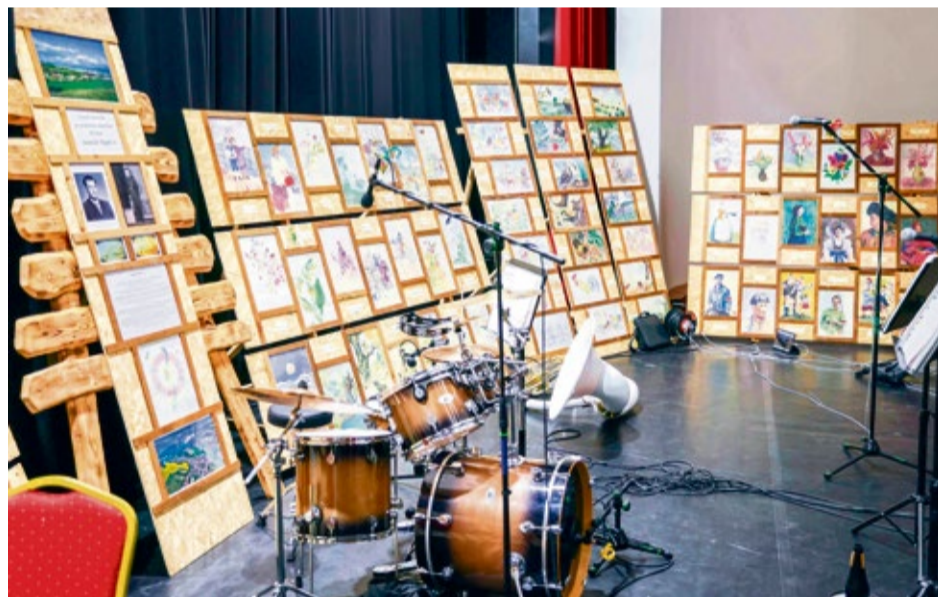
Výstava akvarelov Stanislava Begáňa