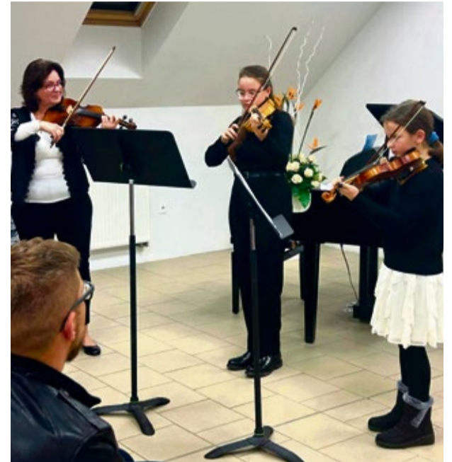
Vystúpenie mladých huslístiek v mestskom múzeu