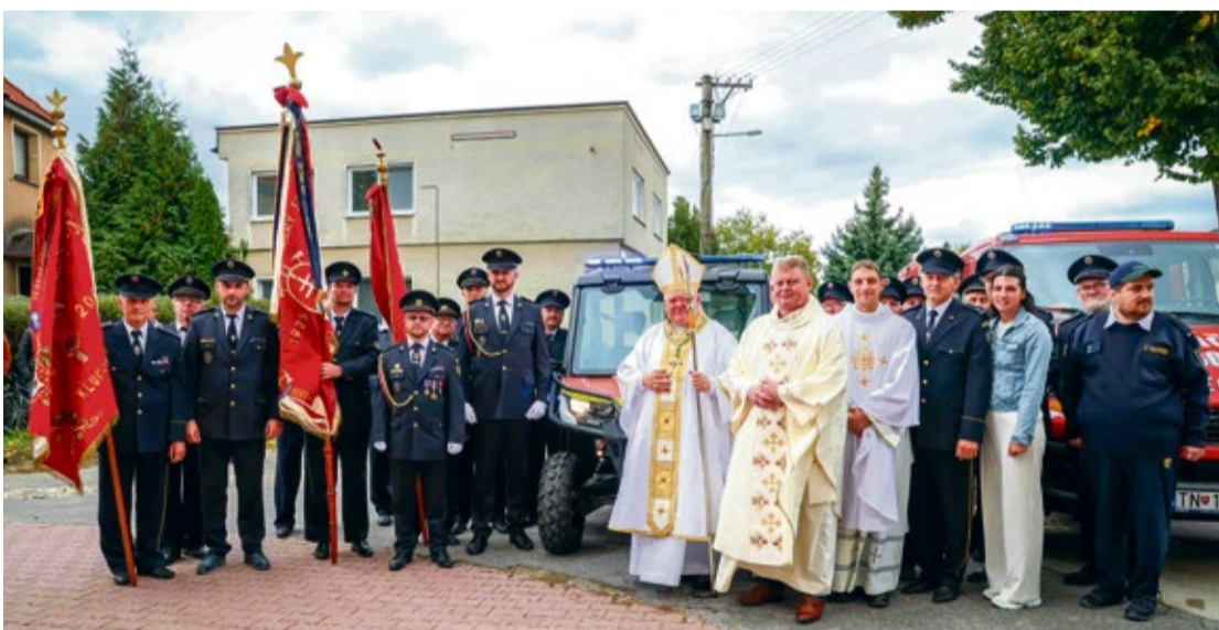
Posvätenie štvorkolky pred kostolom sv. Michala

Spracovala Miroslava Bachratá