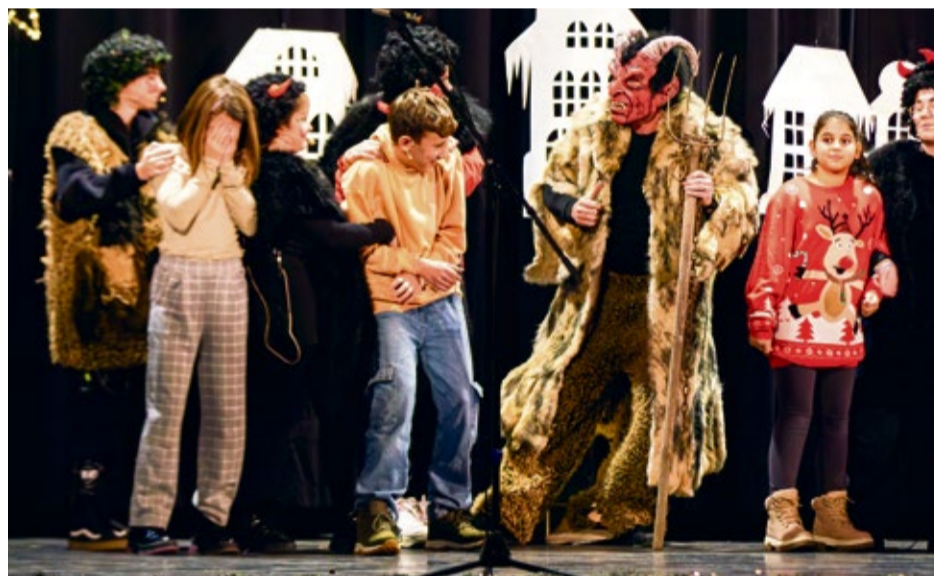
Deti z Nemšovej sa takmer dostali do pekla