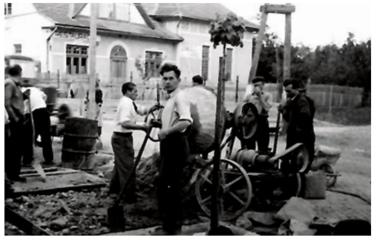
Brigáda učiteľov na chodníkoch, leto 1955