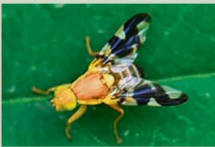
VRTIVKA ORECHOVÁ - Ragoletis completa , je drobná mucha, ktorej

Treba zlikvidovať mušku - vrtivku orechovú v okolí stromu a orechy budete mať zdravé. Ako na to?