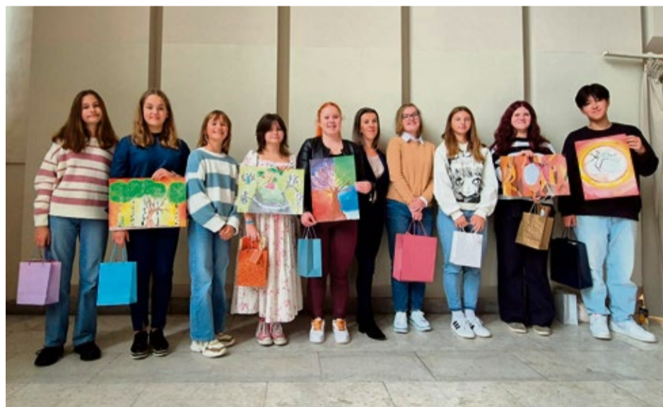
Úspešní ilustrátori súťaže Indické bájky očami detí