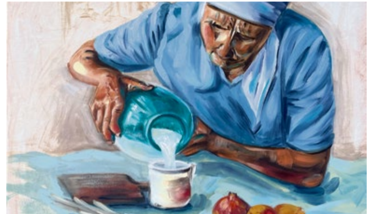
Detail obrazu s názvom Pokojné ráno

■ Moji žiaci sú pre mňa obrovskou inšpiráciou, práve ich nadšenie a odhodlanie ma motivuje hľadať spôsoby, ako z nich dostať to najlepšie. Myslím si, že tajomstvom úspechu je individuálny prístup. Každého žiaka vnímam ako jedinečnú osobnosť s vlastnými schopnosťami, predstavami a potrebami. Verím, že chyby sú neoddeliteľnou súčasťou učenia a často vedú k objaveniu nových techník alebo pohľadov. Každého sa snažím viesť tak, aby si veril a nebál sa experimentovať. Rovnako im