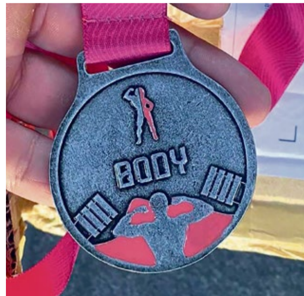
ChampionClub je postavený na troch pilieroch - zdraví, tele a priateľstve. Pamätná medaila Champion Race symbolizuje silu človeka zdoлаť všetky prekážky

Nadšenie k športu, úcta človeka k človeku, pomoc bližnému a v neposlednom rade sila komunity, to všetko môžeme zhrnúť do dvoch slov - Champion club, alebo tiež Champion race. Tam sa to všetko odráža. Celé podujatie i celá myšlienka Champion klubu má tieto tri roviny - športovú, benefičnú a komunitnú.