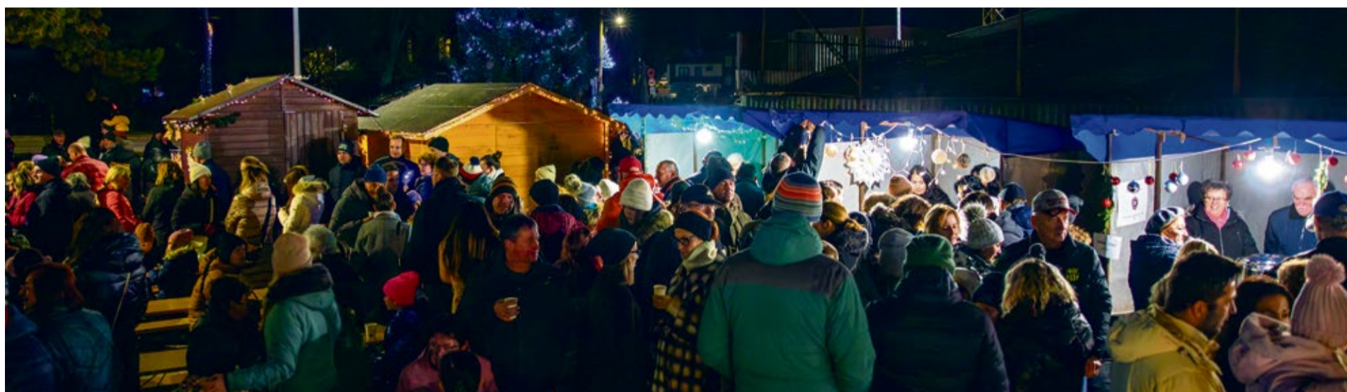
Stovky návštevníkov si vychutnávali predvianočnú atmosféru na mikulášskych trhov v podobe rôznych vôní a chutí.