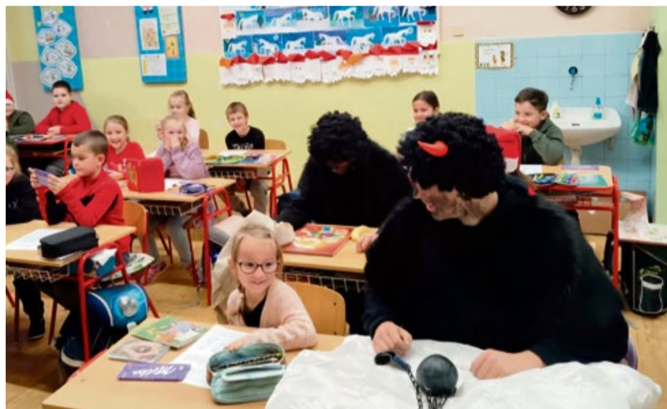
Do lavíc si sadli aj čerti