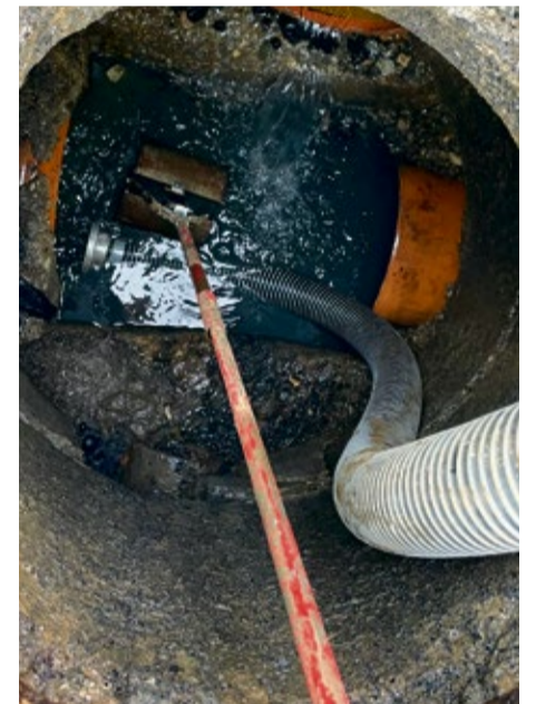
Pohľad do miestnej kanalizácie