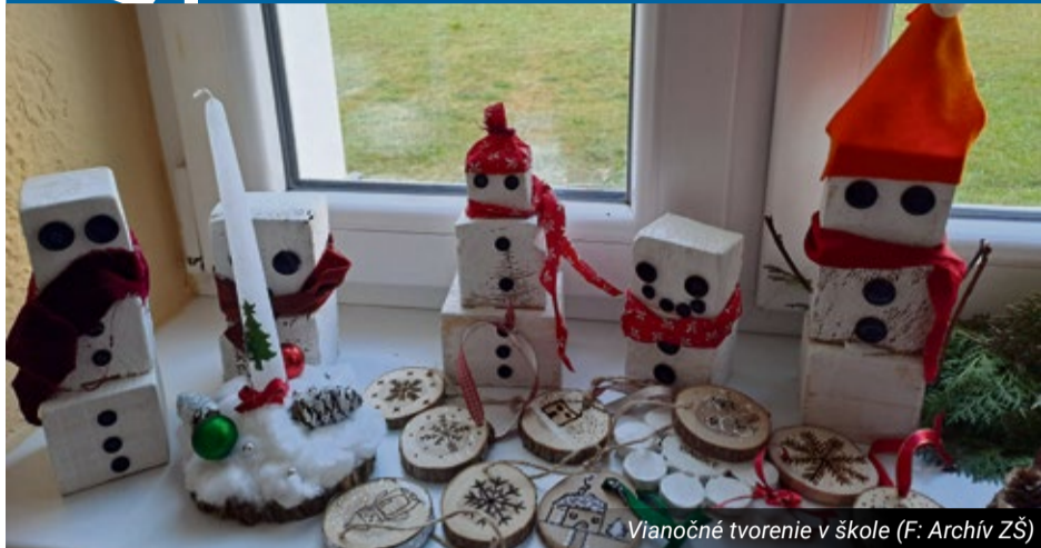
Vianočné tvorenie v škole