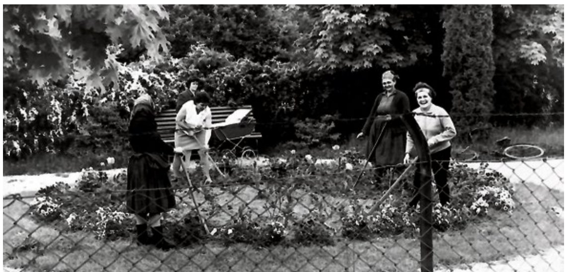
Brigáda v parku, 18. máj 1973

Spracovala a upravila Miroslava Bachratá