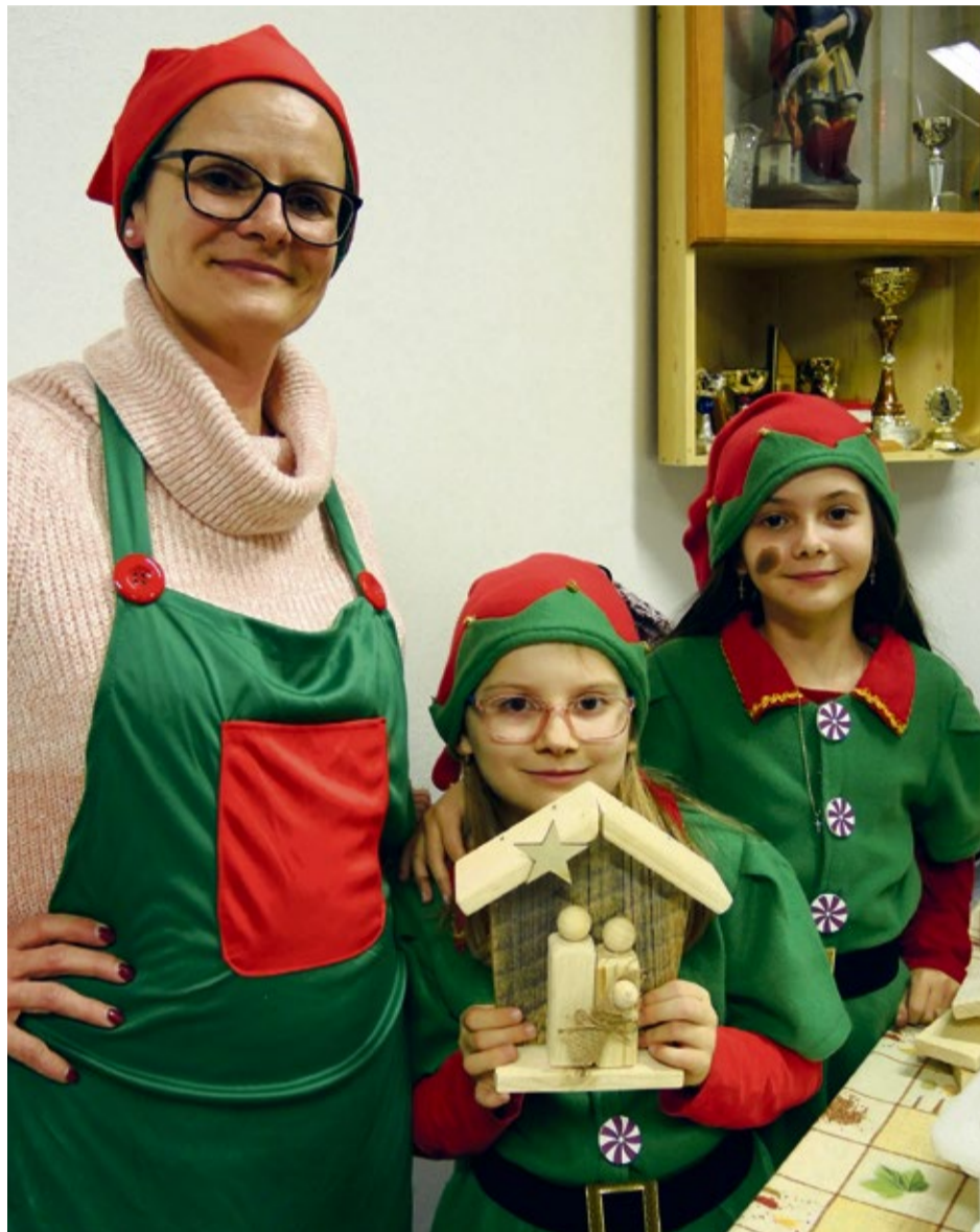
Škriatkovia vo vianočnej dielni Mikuláša v mestskej časti Klúčové

♦ Len za dobrovoľný príspevok OZ Klúčikove si mohli pochutnať na teplom čaji, či punči i sviatočnej kapustnici. Tých najmenších potešili výbehy s kozičkami a koníkmi a odvážnejší sa mohli podeliť s prítomnými o svoj talent v podaní básni, piesní či recitácií na malom pripravenom pódii.