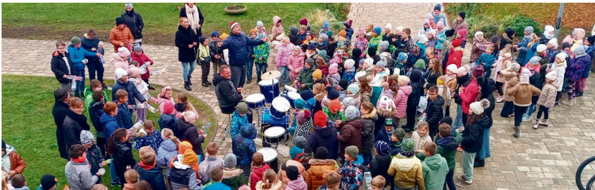
Bubnovačka pred základnou školou