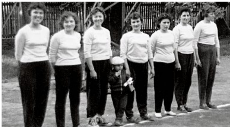
Krajská súťaž žien, 1960