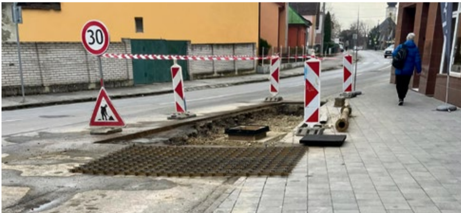
Oprava vody a vybudovanie revíznej šachty