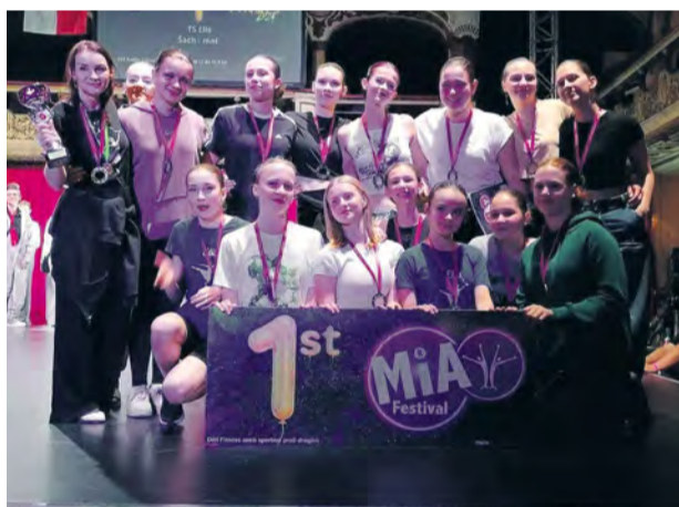
Prvé miesto na tanečnej súťaži v Prahe

Literárno-dramatický odbor svoje sily a prekvapenia zúročil v muzikáli "Noc strašidiel", ktorý mal svoju premiéru 28. a 29.5.2024 v Kultúrnom centre Nemšová. O tom, že muzikál bol očakávaný, svedčí fakt, že oba dni boli úplne vypredané. Sme radi, že na našej škole máme nádejných hercov, ktorí sa aj takýmto spôsobom posúvajú vpred.