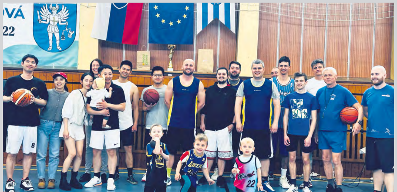
Víťazi basketbalového turnaja