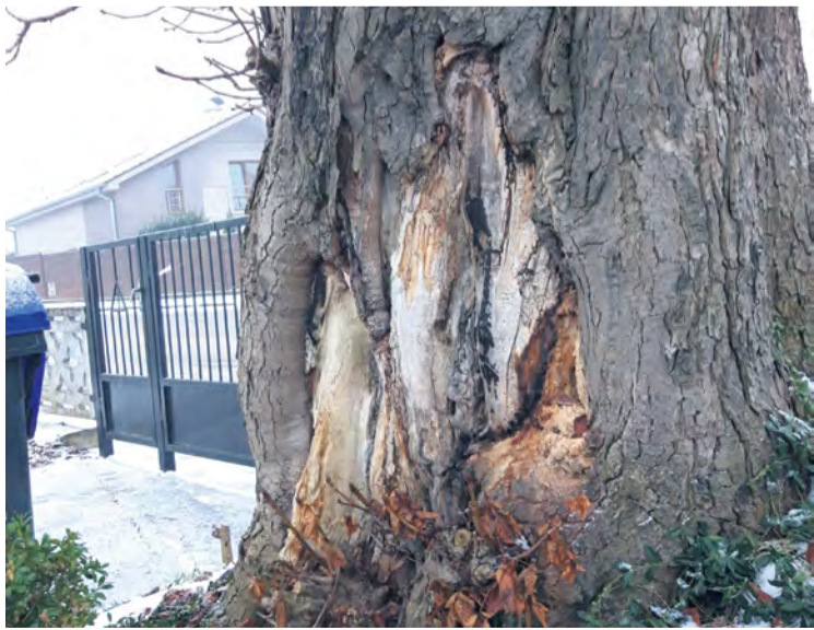
Pagaštan korský - cintorín Nemšová

Radi uvítame vaše podnety a prípadne i spoluprácu na skrášľovaní mesta a prímestských častí.