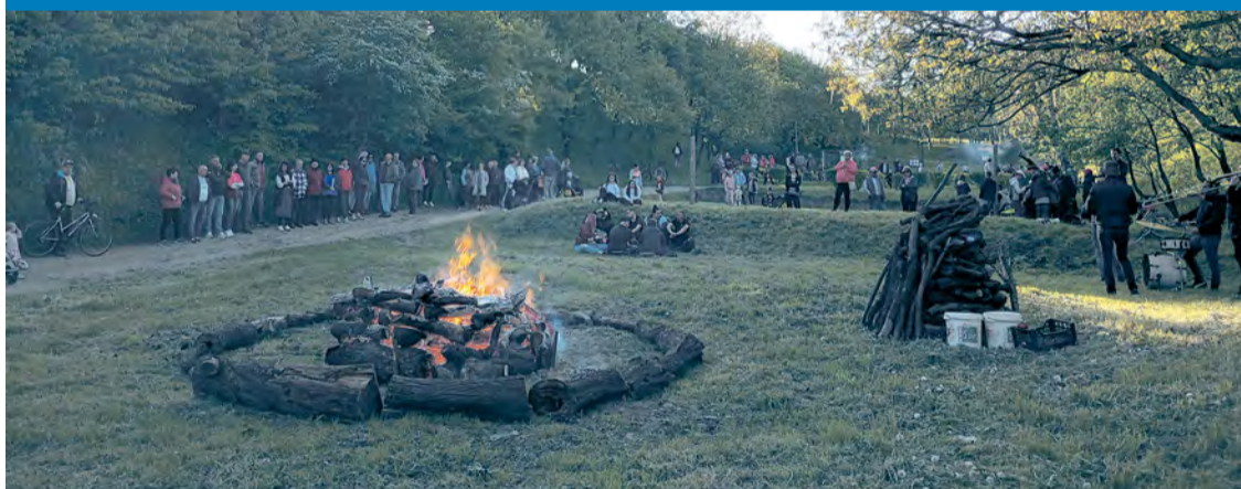
Pálenie Ďura poniže ihriska Nad Cigáňom prilákalo okolo 150 návštevníkov

Páliť vatru v období okolo sviatku sv. Juraja je zvyk, ktorý sa ujal na západnom (či tiež strednom) Slovensku, avšak v posledných rokoch je na ústupe. Svätý Juraj, ktorého mimochodom za svojho patróna považujú Angličania, Gruzínci, ale i skauti, bol vojakom starovekej Rímskej ríše. Podľa legendy bojoval s drakom. O niečo viac pravdivý je fakt o jeho mučeníckej smrti pre vieru počas prenasledovania kresťanov rímskym cisárom Diokleciánom na začiatku 4. storočia nášho letopočtu.