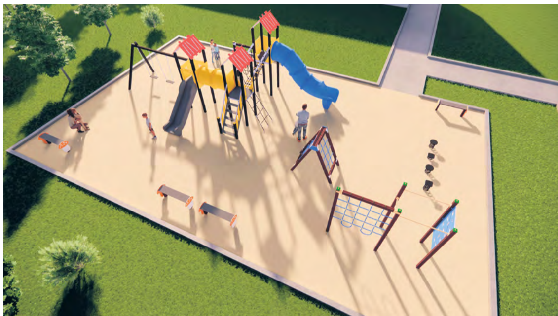
Vizualizácia nového detského ihriska v priestoroch areálu NTS