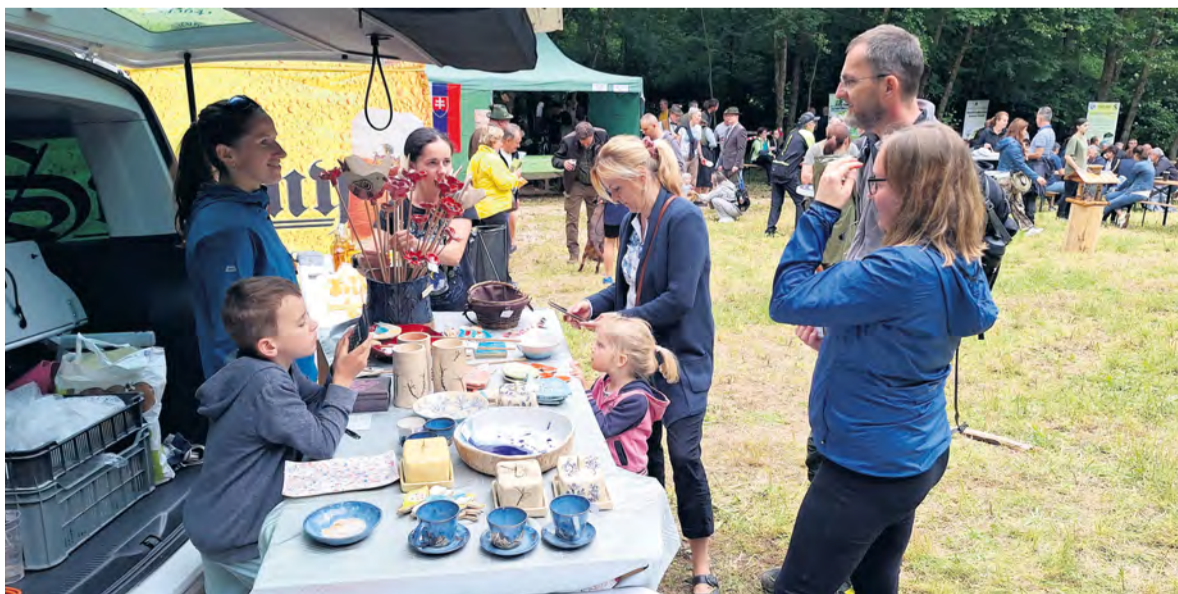
Súčasťou sprievodného programu aj predaj keramických výrobkov