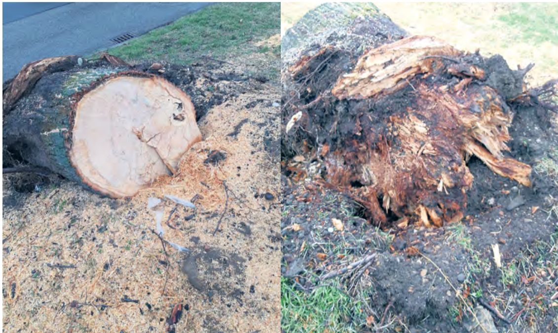
Vyvrátená lipa - kmeň zdravý a koreň odhntý

Pred príchodom jari bolo v Nemšovej vyrúbaných 38 stromov. Bezpečnosť ľudí, najmä na exponovaných miestach, je pre nás prvoradá. Treba niekedy urobiť bolestné radikálne opatrenia. Je nám ľúto, že stúpol počet výrubov, boli však opodstatnené.