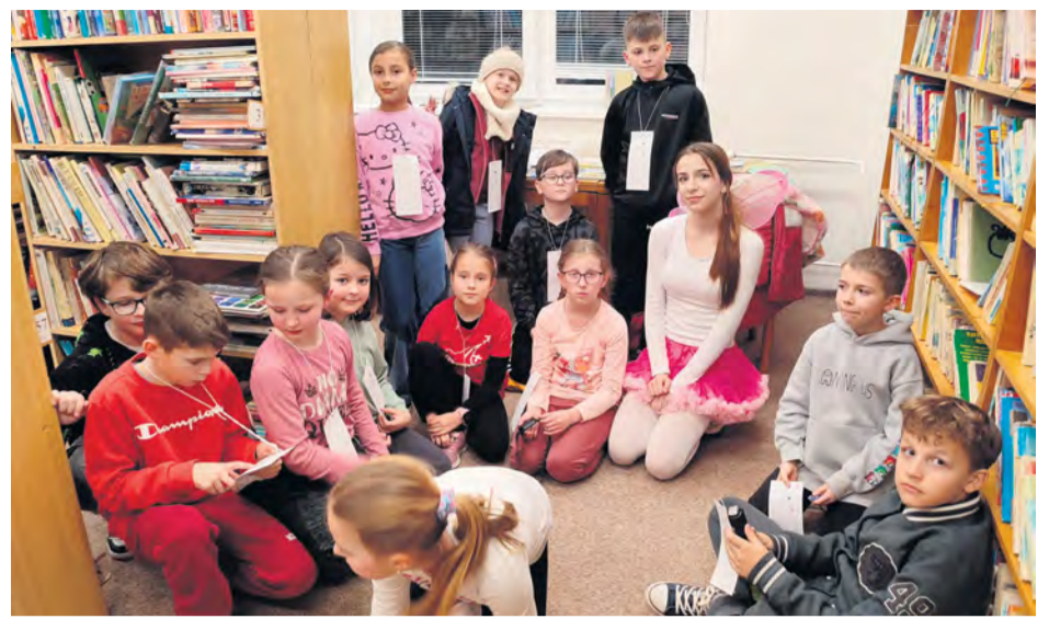
Noc s Andersenom