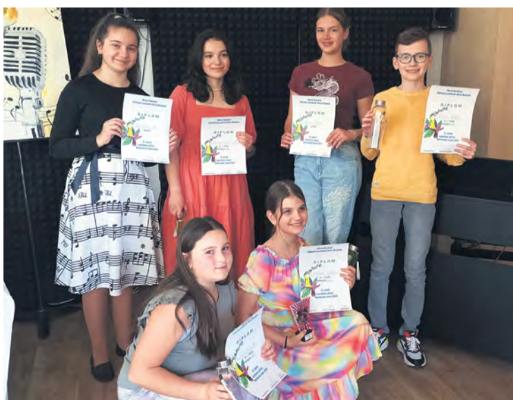
Žiaci zapojení do Nemšovského slávika