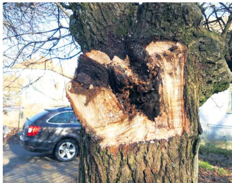
Pagaštan korský - cintorín Nemšová

Mesto Nemšová plánuje pripravovaným VZN o ochrane drevín zamedziť samovoľnému vysádzaniu stromov a kríkov na mestských pozemkoch (časté výsadby blízko pri budovách a v kolízii s inžinierskymi sieťami, ale aj ich poškodzovaniu, úmyselné ničenie nových výsadiel). Potešíme sa, keď i verejnosť prispeje svojimi podnetmi a návrhmi, kde vysádzať nové dreviny, prípadne i pri ich výsadbe. Môžeme zaviesť po vzore iných miest sponzorované výsadby s tabuľkou darcu. Vysádzať plánujeme nižšie stromy, nie alergénne, okrasné listom i kvetom. Medzi novovysadenými stromami sa nachádzajú dreviny: sakury, tulipánovníky, ambrovníky, duby štíhle, katalpy, čerešne Amanogawa,