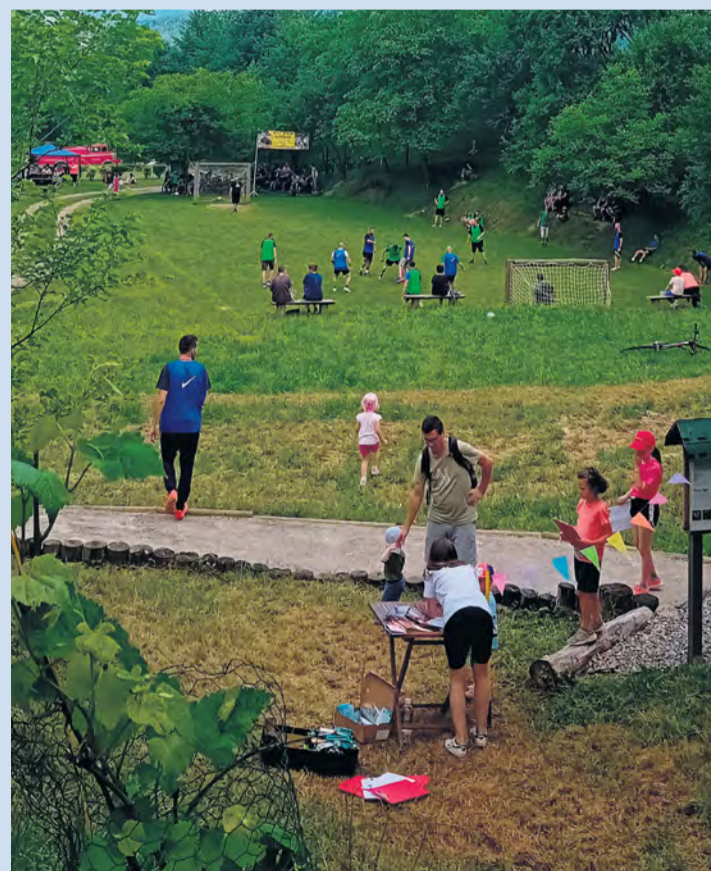
Hodové popoludnie v Parku Jozefa Laca, ale aj na ihrisku Nad Cigáňom