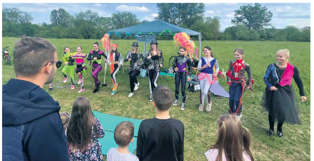
Stanovisko cirkusantiek, tanečného odboru