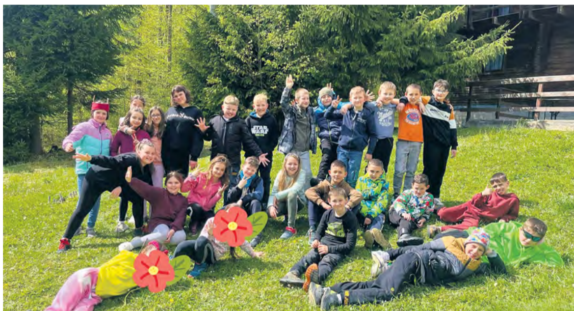
Žiaci v škole v prírode na Myjave