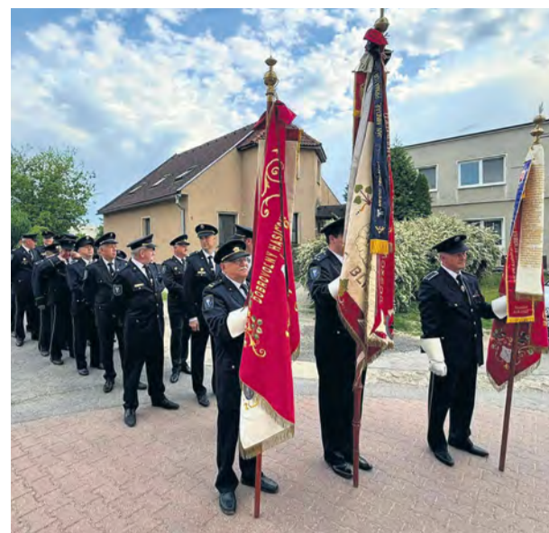
Sviatok svätého Floriána