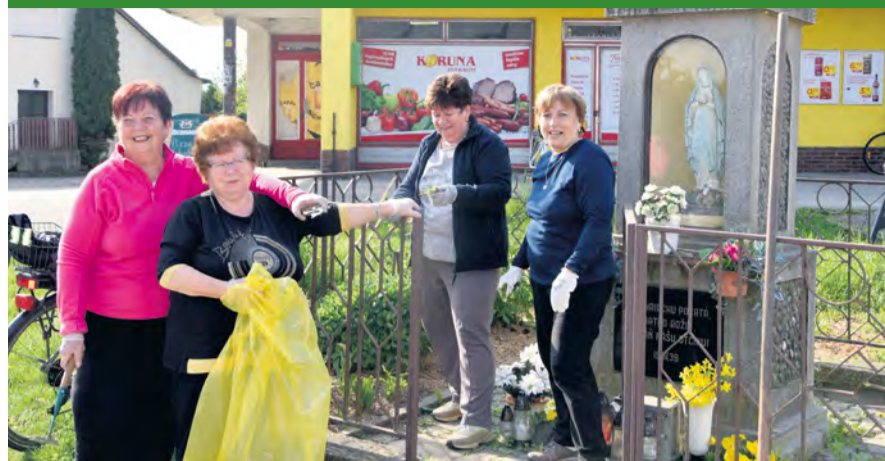
Ženy z miestneho spolku Červeného kríža, Ľuborča - pri kaplnke Panny Márie

► 11. 04. 2024 sa nám podarilo zrealizovať už tradičnú brigádu - Jarné upratovanie v spolupráci s miestnymi združeniami: