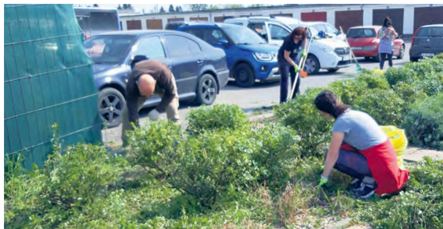
Prímátor mesta a zamestnanci mestského úradu čistia úsek na Železničnej ulici