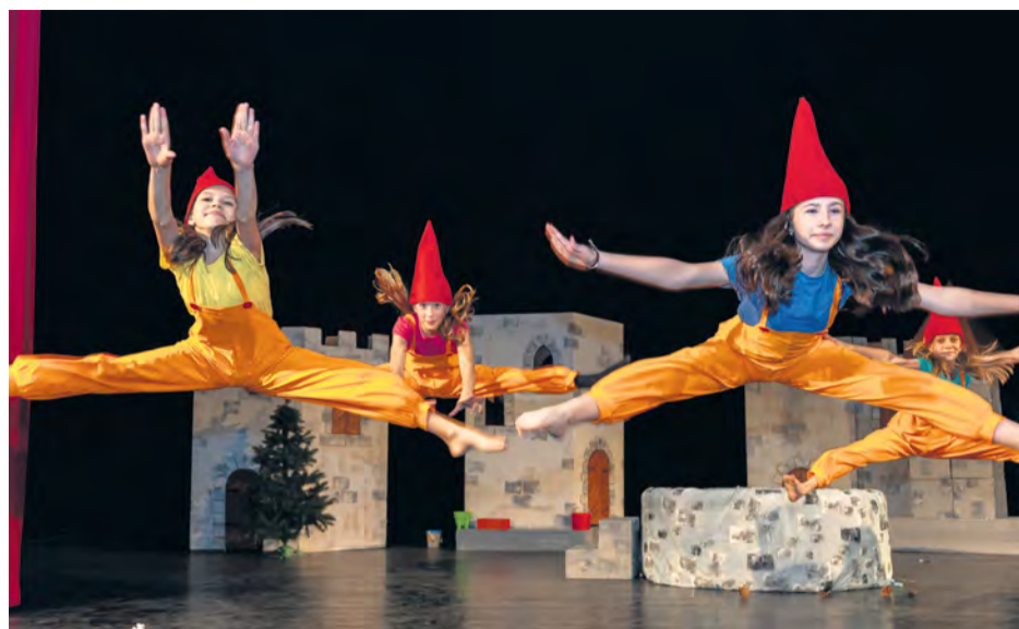
Na javisku sa predstavili aj deti z tanečného odboru ZUŠ

S obsadením hereckých postáv vraj problém nebol. Boli vytvorené dve skupiny detských hercov, alternantov,