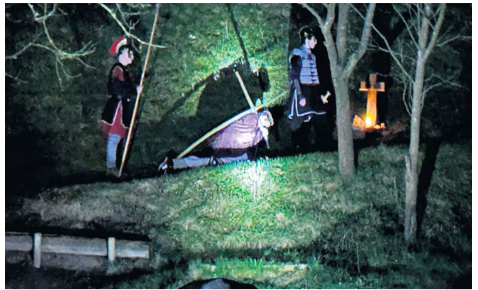
Z hranej krížovej cesty

Dramatickosť celého predstavenia podčiarkol fakt pomerne veterného a čo do zrážok neistého počasia, nakoľko miestami mrholilo, resp. to vyzeralo, že sa čochvíľa spustí silnejší dážď. Umelé osvetlenie bateriek, ktoré celé „divadlo“ v priebehu tmavej noci osvetľovalo, bolo utlmené práve vo chvíli, keď ukrižovaný Ježiš odovzdal svojho ducha Bohu. Na predstavenie spojené s modlitbou krížovej cesty si našlo cestu približne 150 až 200 ľudí. Z reakcie väčšiny opýtaných možno povedať, že sa im veľmi páčilo. Okrem atraktívnej scény a komorného hudobného doprovodu boli v rámci krížovej cesty tiež čítané zamyslenia k zastaveniam krížovej cesty, ktoré sú mimochodom prostredníctvom QR kódov umiestnené na krížoch v areáli. Zamyslenia v minulom roku tvorili spoločne členovia OZ Hravé hlavy a Farského spoločenstva sv. Michala archanjela a sú dostupné aj na internetovej stránke www.hravehlavy.webnode.sk/krizova-cesta .