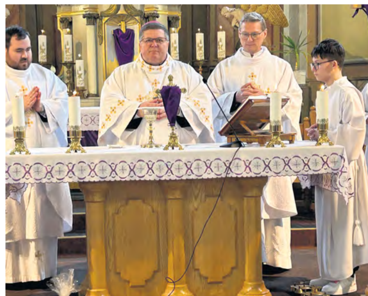
Vzácná návšteva z Nitry