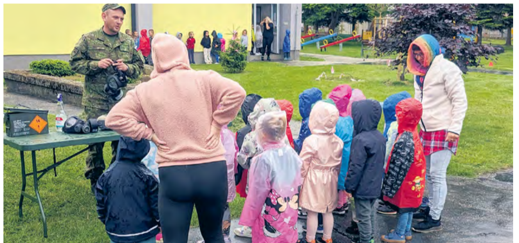
Ukážka použitia prostriedkov individuálnej ochrany