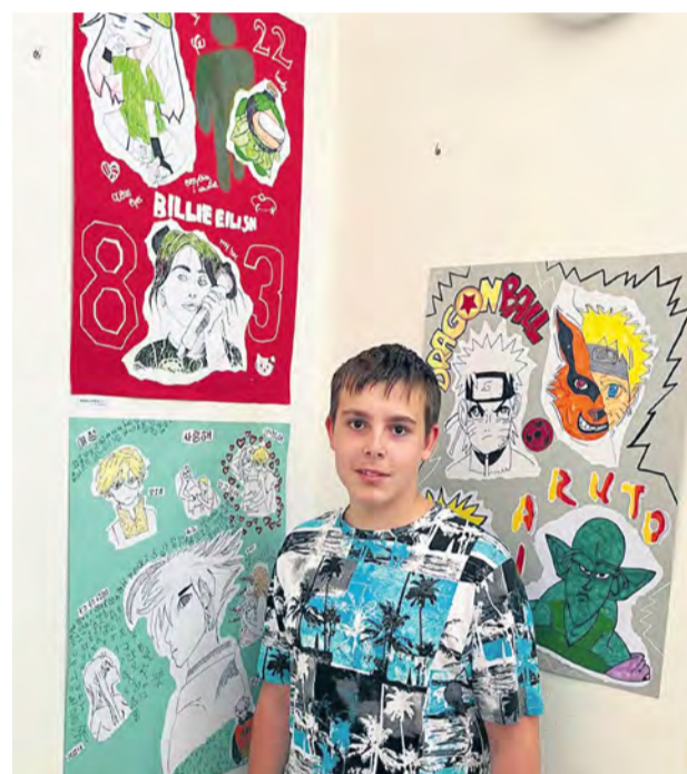
Z vernisáže výtvarných prác