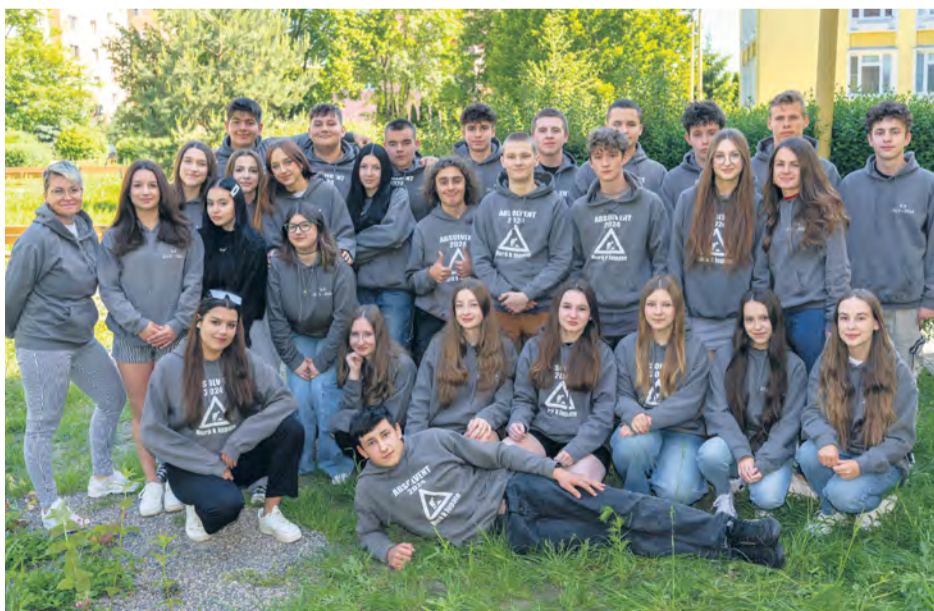
Úspešní deviataci zo ZŠ, Janka Palu