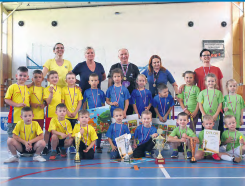
9. ročník florbalového turnaja o putovný pohár materskej školy

V materskej škole, vo všetkých prevádzkach, sa s jarným slniečkom spustilo množstvo spoločenských a športových aktivít. Za pozornosť stojí 9. ročník florbalového turnaja o putovný pohár materskej školy, ktorý sa po objektívnej štvorročnej prestávke konal 23. mája v športovej hale.