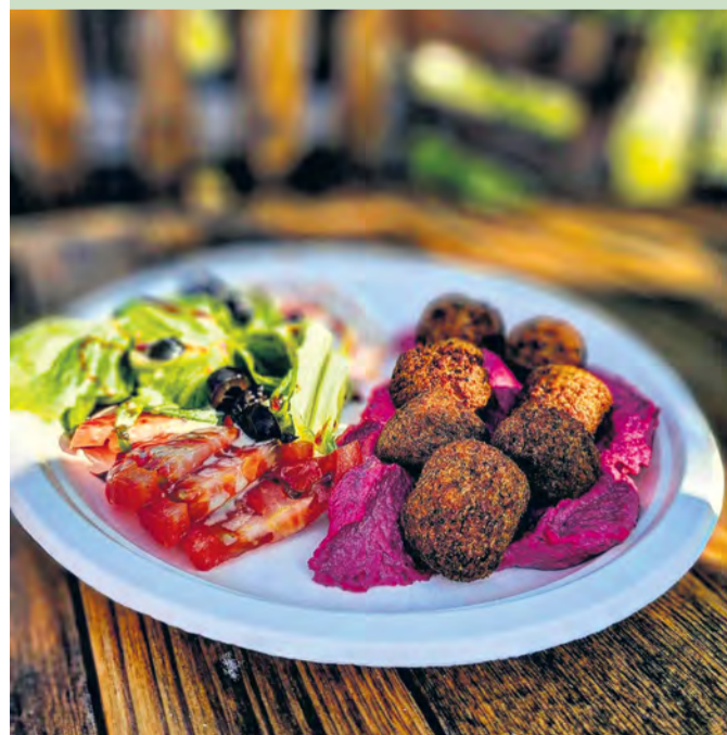
Chutný vegánsky obedík v miestnom bistre - falafel s cviklovým humusom a šalátom