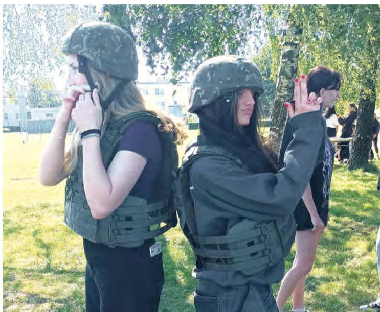
Prehliadka vojenskej techniky v priestoroch KSS