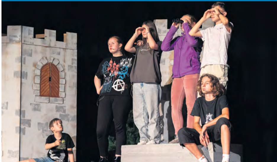
Detskí herci počas druhej premiéry