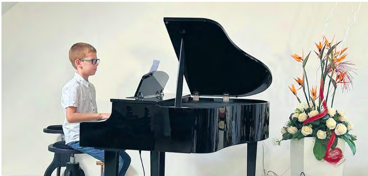
Hudobné srdiečko pre mamičku

miestnych, regionálnych, celoslovenských i tých medzinárodných