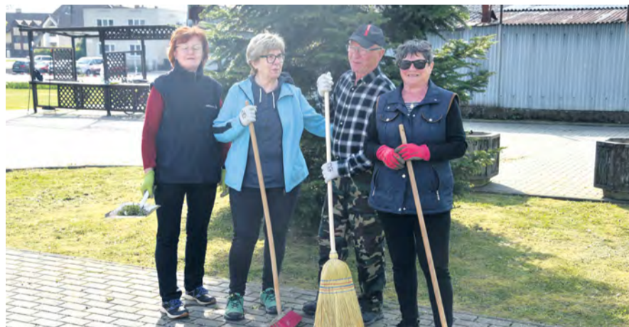
Členovia OZ Peregrín pri úprave priestorov múzea