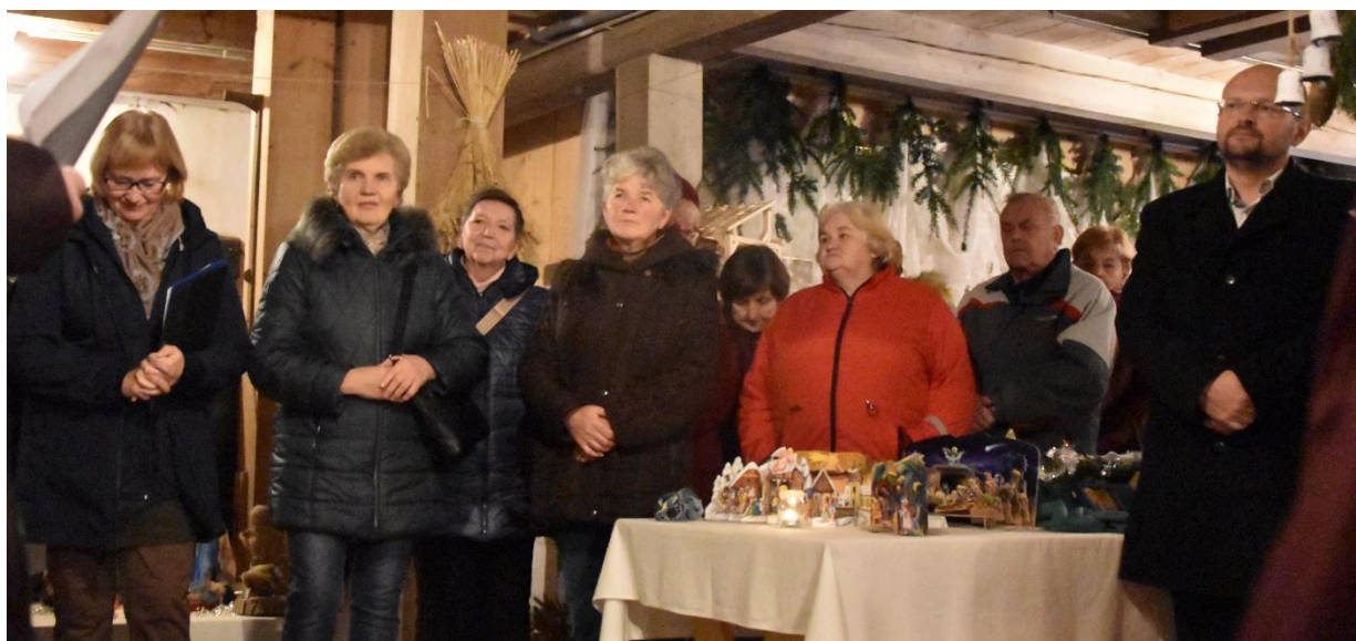
Obrázok 12 Otvorenie výstavy betlehemov v Králikovom mlyne, 26. november 2022