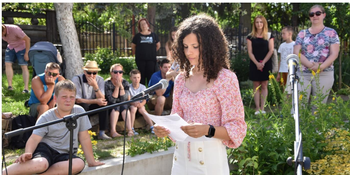
Obrázok 4 Od zrnka k chlebu výtvarno-literárna súťaž v Králikovom mlyne, 22. jún 2022