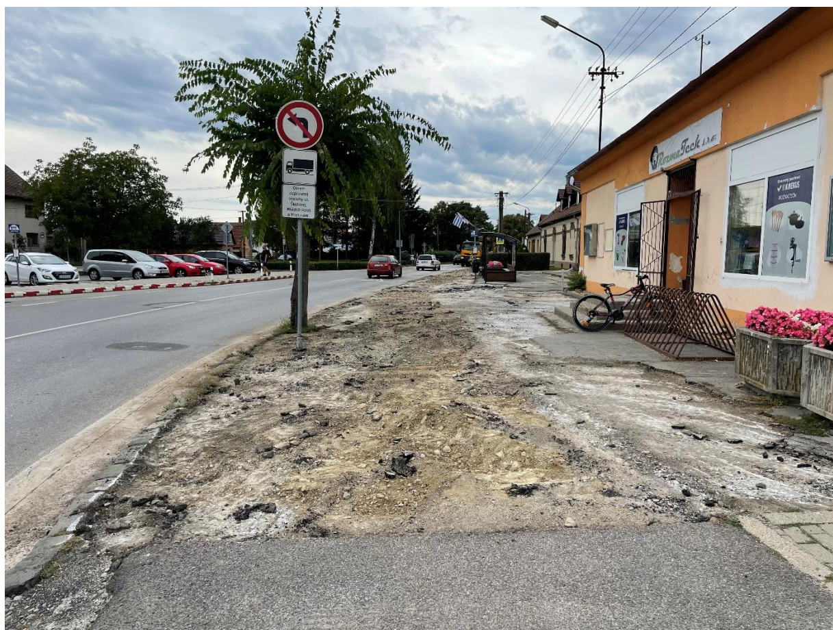
Obrázok 16 Stav chodníka na Mierovom námestí počas rekonštrukčných prác

REKONŠTRUKCIA CHODNÍKA – MIEROVÉ NÁMESTIE Spoločnosť Slovak Telekom na predmetnom chodníku najskôr realizovala modernizáciu rozvodov optickej siete. Keďže išlo o stavbu vo verejnom záujme, mesto Nemšová muselo strpieť jej výkon. Snahou mesta bolo, aby realizátor uviedol chodníky a mestskú zeleň do pôvodného stavu. V prípade chodníka v úseku od kúpaliska po Rozmatech mesto uznalo, že oprava formou lokálnej opravy by na danom mieste nebola esteticky vhodná, a tak pristúpili k dohode, že opravu po výkope vykoná mesto, a to komplexne v plnej šírke a v maximálnej kvalite. Tento proces si však vyžadoval geodetické zameranie, vypracovanie projektovej dokumentácie a jej schválenie. V roku 2022 bolo realizované verejné obstarávanie na zhotoviteľa. Víťazom súťaže sa stala firma PEMAL, s. r. o., a cena diela bola stanovená na 105 138,46 €. Firma s prácami skončila koncom mesiaca október.