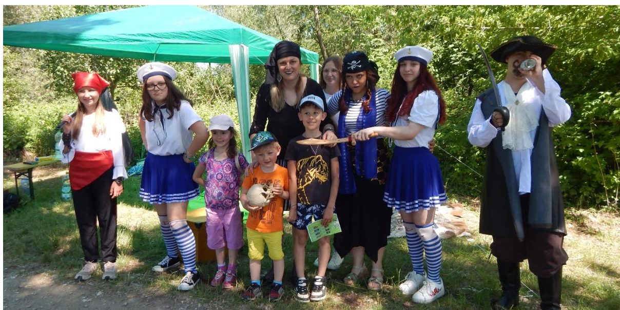
Obrázok 3 Jedno zo stanovísk na podujatí Cesta rozprávkovým lesom, 5. jún 2022