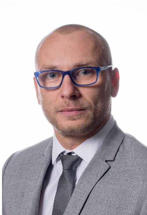
ZÁSTUPCA PRIMÁTORA MESTA NEMŠOVÁ