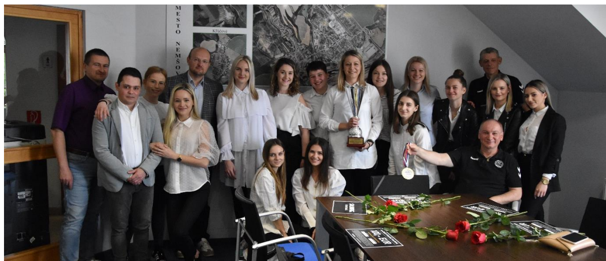
Obrázok 18 Florbalistky na mestskom úrade