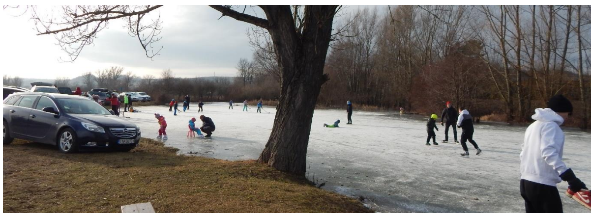
Obrázok 1 korčuľovanie na Važinách, mestská časť Klúčové

V úvode roka boli na dané ročné obdobie zaznamenané veľmi vysoké teploty. Prvého januára bolo v Nemšovej nameraných +13 °C a druhého januára dokonca +15 °C . Takmer celý január bol v znamení denných teplôt mierne nad 0 °C a mínusové hodnoty prevládali najmä v nočných hodinách. Mierne pod bodom mrazu bolo počas dňa až 12. januára. Dni boli prevažne slnečné. Viac ako týždeň trvajúce mínusové nočné teploty pod -5 °C dožičili miestnemu obyvateľstvu, aby využili zamrznuté vodné plochy, napríklad na Klúčovských Važinách, kde sa vo veľkom korčuľovalo niekoľko dní. Koncom januára sa mierne oteplilo, objavil sa silný vietor a začiatkom februára napadol nový sneh, neudržel sa však dlho, deň - dva. Teploty sa pohybovali okolo +5 °C .