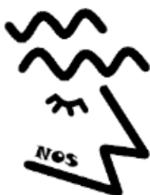
Obrázok 17 Logo NOS