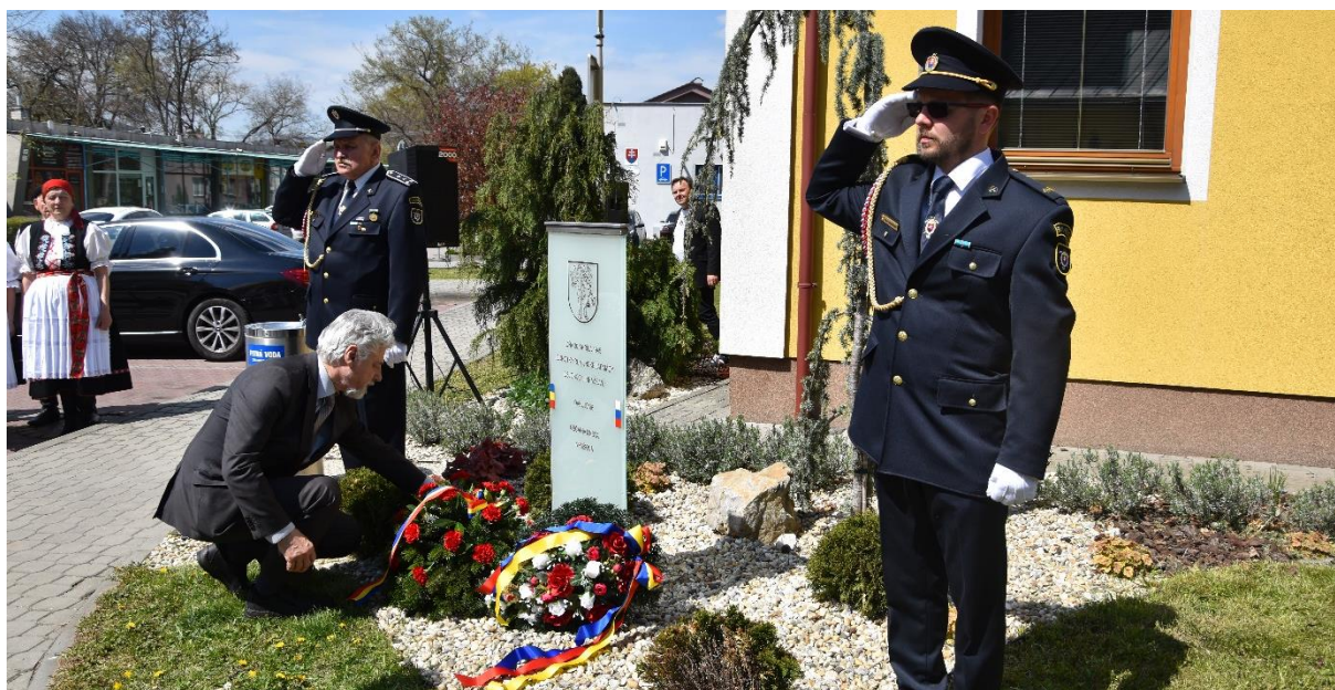
77. výročie oslobodenia obce rumunskou armádou, 29. apríl 2022