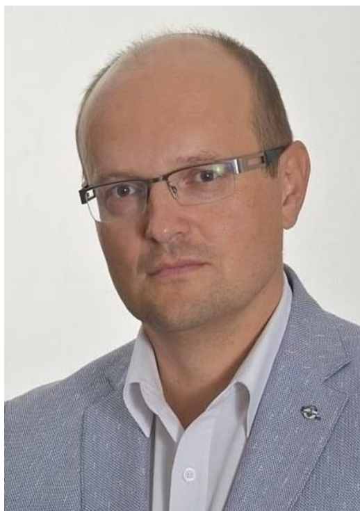
PRIMÁTOR MESTA NEMŠOVÁ