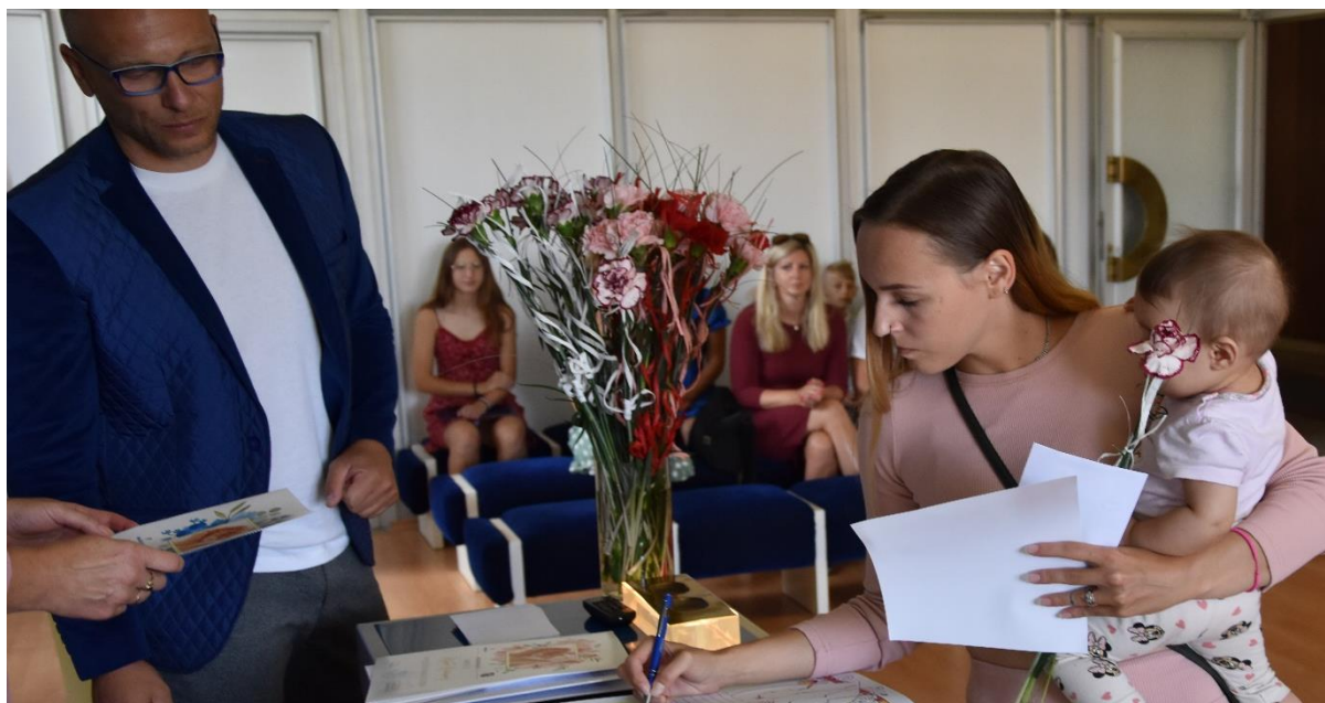
Obrázok 5 Uvítanie detí do života, 7. júl 2022

SLÁVNOSTNÉ UVÍTANIE DETÍ DO ŽIVOTA Pravidelne pripravované podujatie, na ktorom si tých najmenších ctia zápisom do pamätnej knihy mesta, pamätným listom a finančným darom, sa uskutočnilo 7. júla. Zástupca primátora privítal 39 detí, z toho 25 dievčat, narodených od 29. októbra 2021 do 26. júna 2022. Pogrataloval rodičom k prírastku do rodiny a mamičkám odovzdal krásny kvet. Rodičia sa zapísali do pamätnej knihy a odfotografovali sa pri tradičnej drevenej kolíske.