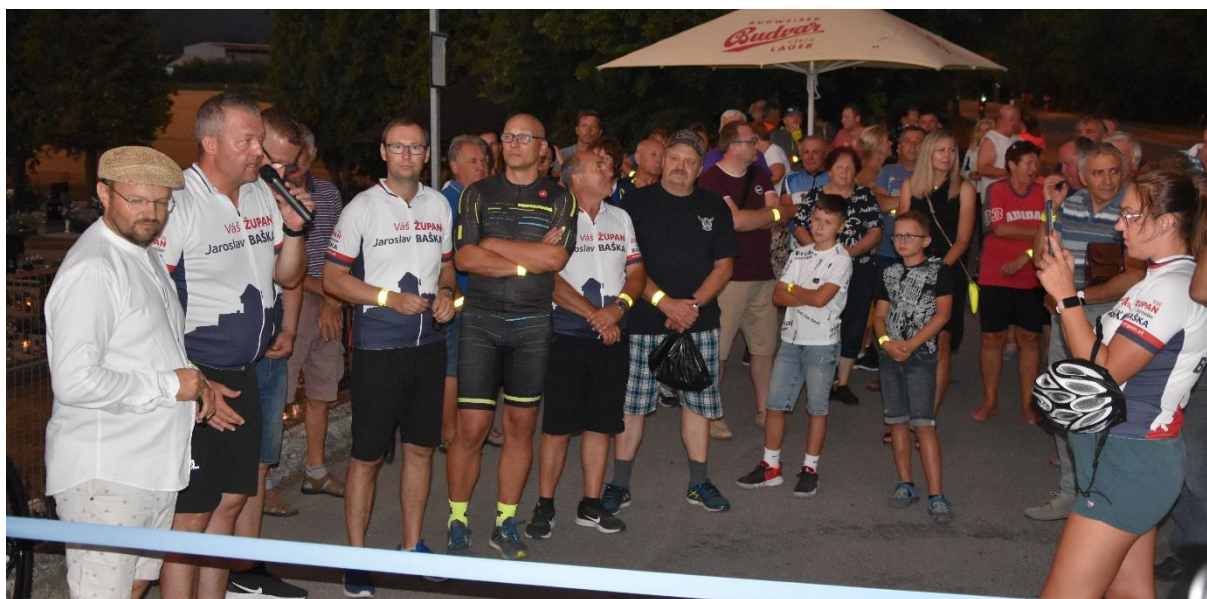
Obrázok 6 Slávnostné ukončenie prác na cyklotrase Kľúčové- Luborča predstaviteľmi TSK a mesta Nemšová, 29. júla 2022

KEŤOVSKÁ POHODA Podujatie bolo organizované FK Kľúčové od 28. júla do 1. augusta. Podujatie organizátori otvorili letným kinom, v piatok pokračovala zábava s disco party v podaní DJ Roba Hálu. Napriek nepriazni počasia, ktorá sprevádzala celé podujatie, sa v sobotu uskutočnila Oldies party DJ Roba Hala s HAWKOM. V nedeľu sa uskutočnila slávnostná svätá omša v miestnej kaplnke Sv. Anny. Po nej sa uskutočnil mládežnícky futbalový zápas, futbalový zápas Vavrušovci vs. Ostatní, kopanie jedenástok a deň zavŕšili tanečnou zábavou DH Kamarádi. Hody skončili v pondelok posedením pri kaštieli. V piatok a v sobotu privítali organizátori viac ako 1 200 ľudí a v nedeľu a pondelok sa prišlo zabaviť 400 ľudí.