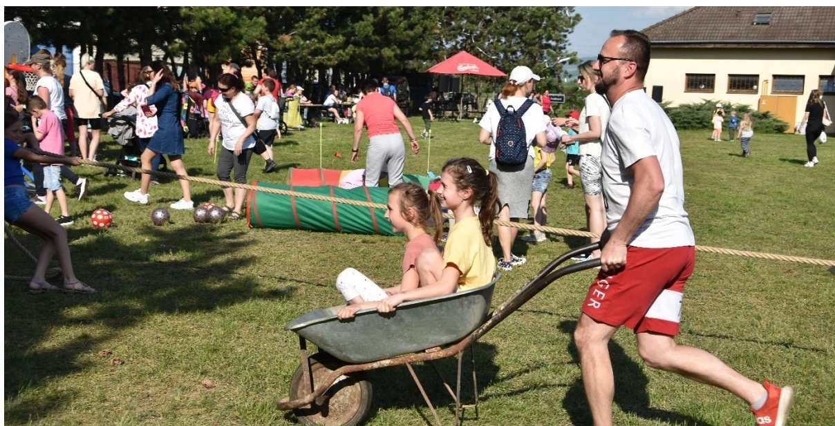
Obrázok 2 Účastníci Dňa pre rodinu, 12. máj 2022