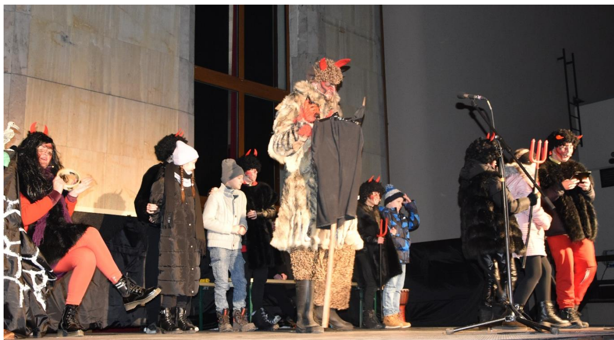
Obrázok 13 Divadelné predstavenie o príchode sv. Mikuláša, za kultúrnym domom v Nemšovej