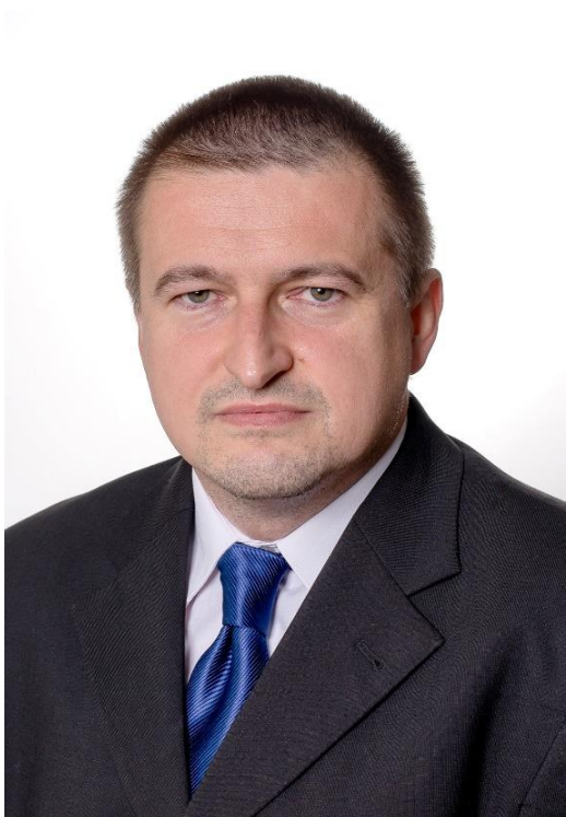
PREDNOSTA MESTSKÉHO ÚRADU