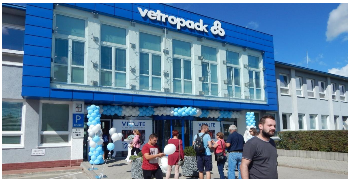
Obrázok 9 Deň otvorených dverí spoločnosti Vetropack, s. r. o., 10. september 2022

Deň otvorených dverí spoločnosti Vetropack, s. r. o., 10. september 2022