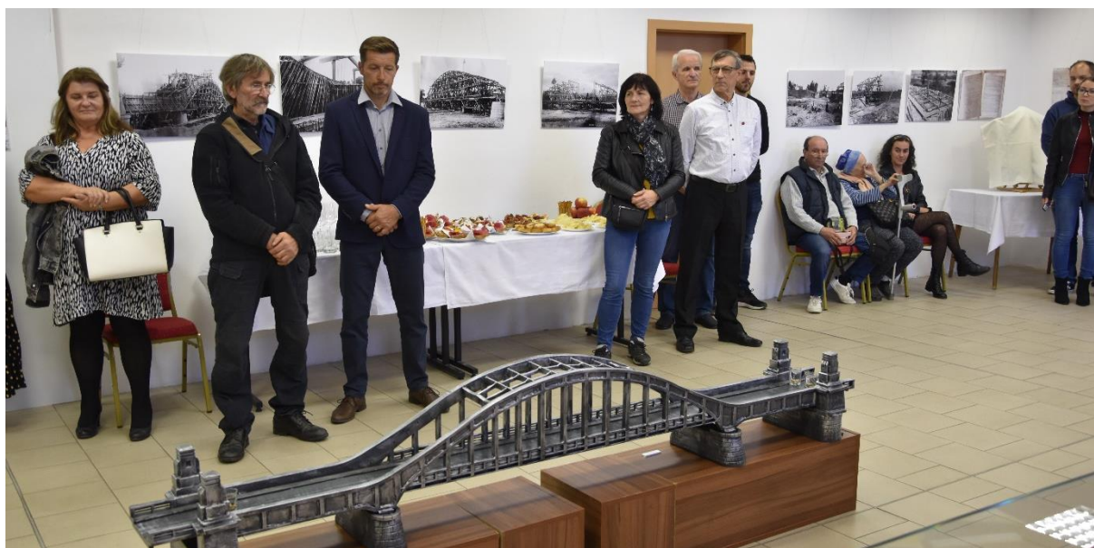
Obrázok 11 Spoločná vernisáž historických výstav 1. písomnej zmienky a mosta T. G. Masaryka. 6.októbra 2022

Základnou myšlienkou bolo v archívoch nájsť projektovú dokumentáciu, ktorá by poslúžila ako podklad na vytvorenie jeho modelu. V Národnom archíve v Bratislave nakoniec našli projektovú dokumentáciu, celý stavebný denník, statické výpočty a najmä fotografie zo stavby, ktoré takmer 100 rokov nikto nevidel, sú veľkým úspechom pre rozšírenie histórie nášho mesta. Výstava prezentovala výsledky výskumu a najmä fotografie, ktoré ukazujú, ako sa staval most T. G. Masaryka cez rieku Vlára.