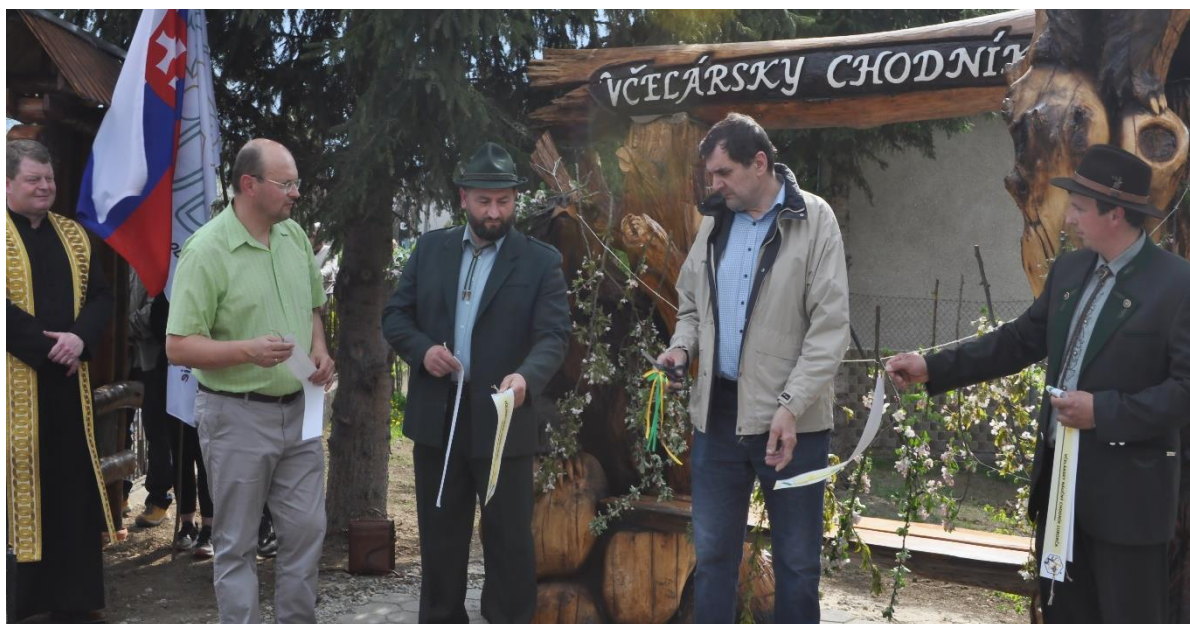
Otvorenie náučného včelárskeho chodníka, 1. máj 2022

VČELÁRSKY NÁUČNÝ CHODNÍK Dňa 1. mája sa uskutočnilo verejné podujatie, slávnostné otvorenie včelárskeho náučného chodníka . Myšlienka chodníka vznikla pri zamýšľaní sa miestnych včelárov nad dôležitosťou včelárstva pre ľudstvo. Projekt realizovalo občianske združenie Hubert Ľuborča v spolupráci s mestom Nemšová, množstvom dobrovoľníkov a nadšencov prírody. Prvý máj vybrali realizátori nie náhodou. Okrem toho, že tento deň slávime sviatok práce, tak v tento deň je v cirkevnom liturgickom kalendári sviatok sv. Jozefa, patróna robotníkov. Keďže aj včelári, aj ich včely sú veľmi pracovité a veľmi prospešné pre spoločnosť, realizátori symbolicky zvolili tento dátum. Včelársky náučný chodník začína v Ľuborči pri Základnej umeleckej škole a materskej škole, kde bola osadená drevená socha medveďov s lavičkou a nápisom včelársky chodník. Na informačných tabuliach sa dozvedáme zaujímavé informácie zo života včiel a včelárov. Včelársky chodník plynulo nadväzuje na poľovnícky náučný chodník, ktorý prechádza Ľuborčianskou dolinou a lesom prechádza až do Trenčianskej Závady.