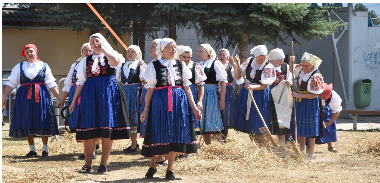
Obrázok 7 Výstúpenie folklórnej skupiny Liborčan, Nemšovský jarmok 13. augusta 2022

NEMŠOVSKÝ JARMOK Jarmok sa konal po 26-krát a druhýkrát v nových priestoroch. Realizoval sa v dňoch 12. a 13. augusta v areáli NTS . Na tohtoročnom tradičnom jarmoku, ktorý sa konal v duchu 780. výročia prvej písomnej zmienky, sme mohli vidieť viac ako 120 stánkov. Jarmok navštívilo niekoľko tisíc návštevníkov. Pri príležitosti výročia mesto dalo občanom možnosť odfotiť sa pri fotokútiku na tému výročia alebo si kúpiť originálne tričko s transformovaným logom, kde namiesto farebných kruhov boli znázornené pečate jednotlivých mestských častí. Originálne logo vzniklo ešte pri 775. výročí mesta. V tomto roku bolo toto logo vidieť po celom meste vo forme vlajok.